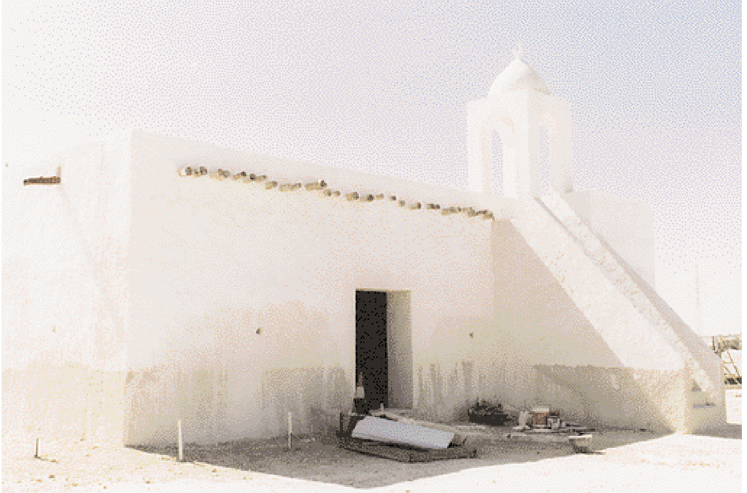
Le plus ancien minaret de Qatar.