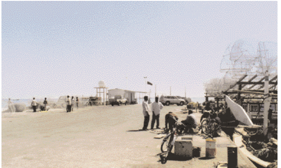
Filet de pêche et port.