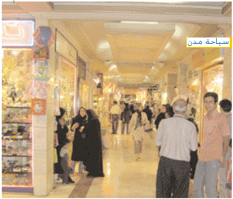
Modern shopping centre.