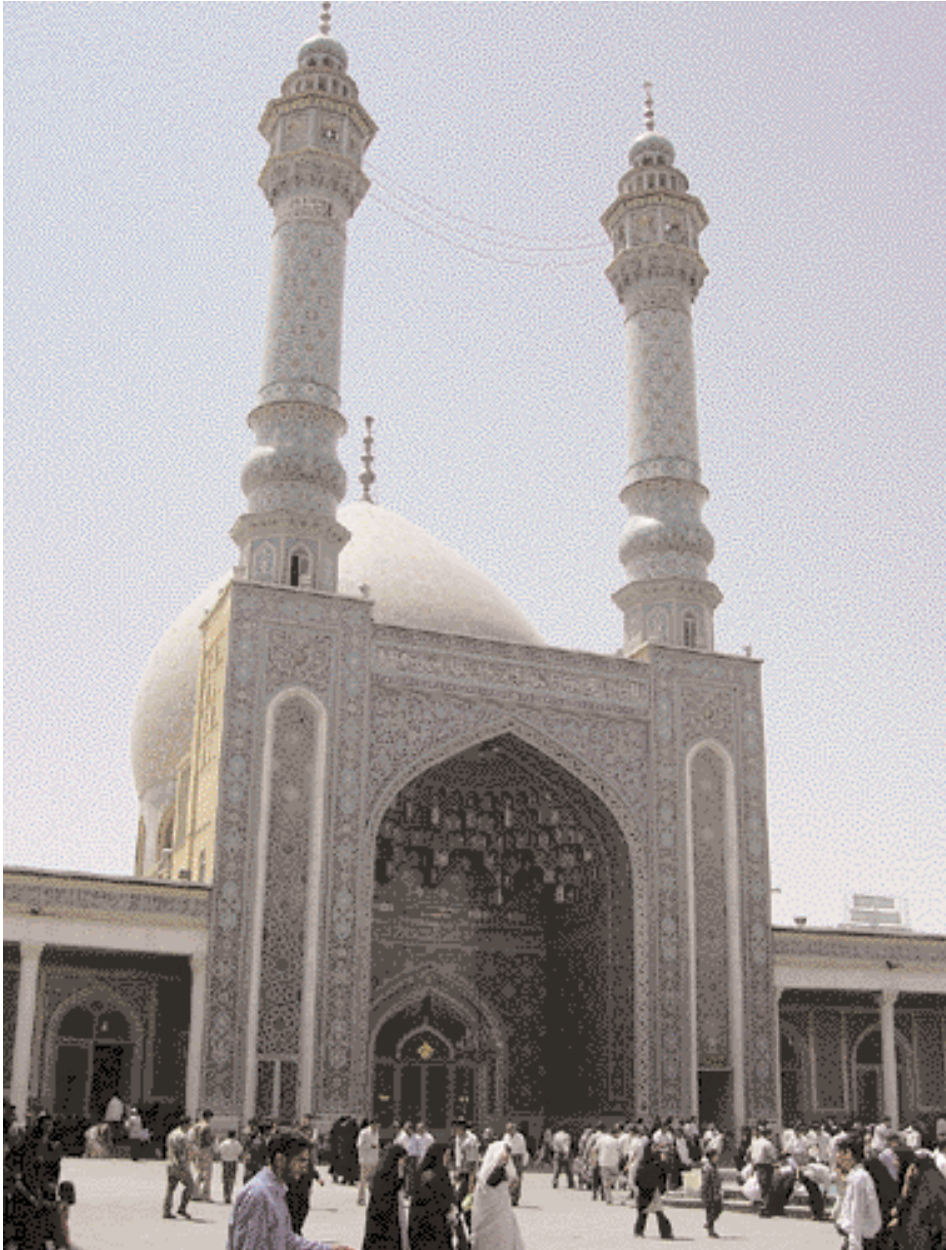
Syeeda Masoumah/ Qum.