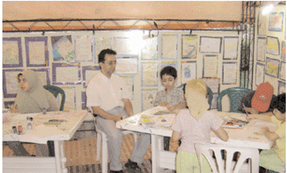
The children exhibition.