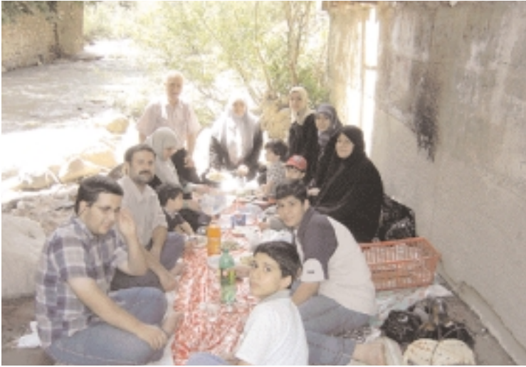
A family picnic by the waterfall.