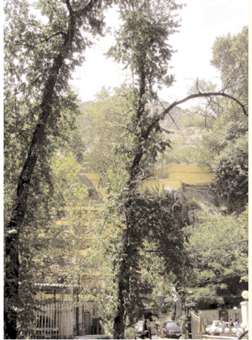
The forest of Darband.

عروسان جدیدان في جناح السياحة الإسلامية.