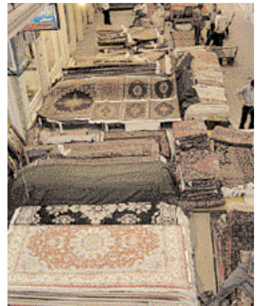
سوق السجاد في طهران. The carpet market in Tehran.