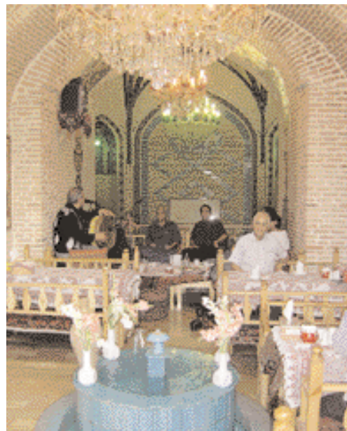
مطعم الخيام التقليدي في طهران. Khayam Restaurant in Tehran.

وويأتي تشجيع المرأة الإيرانية على الدخول في مجال الأعمال. وهو الأمر الذي لاحظته بجلاء بعد غياب 40 سنة. ليكون عاملاً إيجابياً في الوقت الذي تعد فيه إيران العدة والبنية التحتية. وأهمها التوسع في شبكات الطرق والسكك الحديدية والفنادق وغيرها من مستلزمات السفر والإقامة. لدخول أسواق السياحة العالمية بقوة وجأح. ■