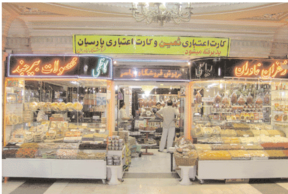
Herbs and sweet shop.

إن هذه المساحات الشاسعة للأروقة والباحات التي تعد بعشرات الآلاف من الأمتار المربعة لم تستوعب عدد الزوار في داخلها. وقد تمكنت من زيارة الحرم مرتين. الأولى بعد الساعة العاشرة مساءً، والثانية بعد صلاة الظهر. ولم أتمكن من الوصول إلى <