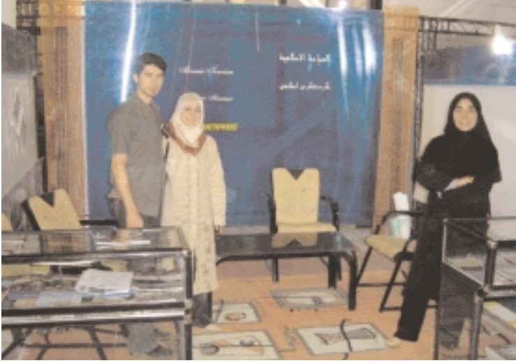
Newly wedded couple in Islamic Tourism stand.

عروسان جدیدان في جناح السياحة الإسلامية.