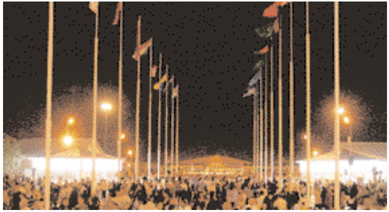
General view of the exhibition site.