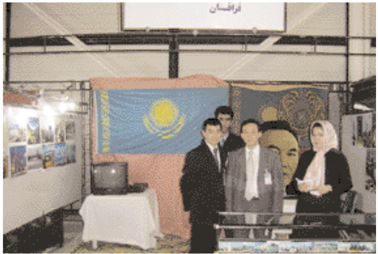
With the Kergazian and the Kazakh consular at Kazakhstan stand.

مع قنصلي قرغيزيا وكازاخستان في جناح كازاخستان.