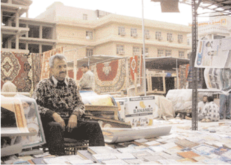
The books seller.