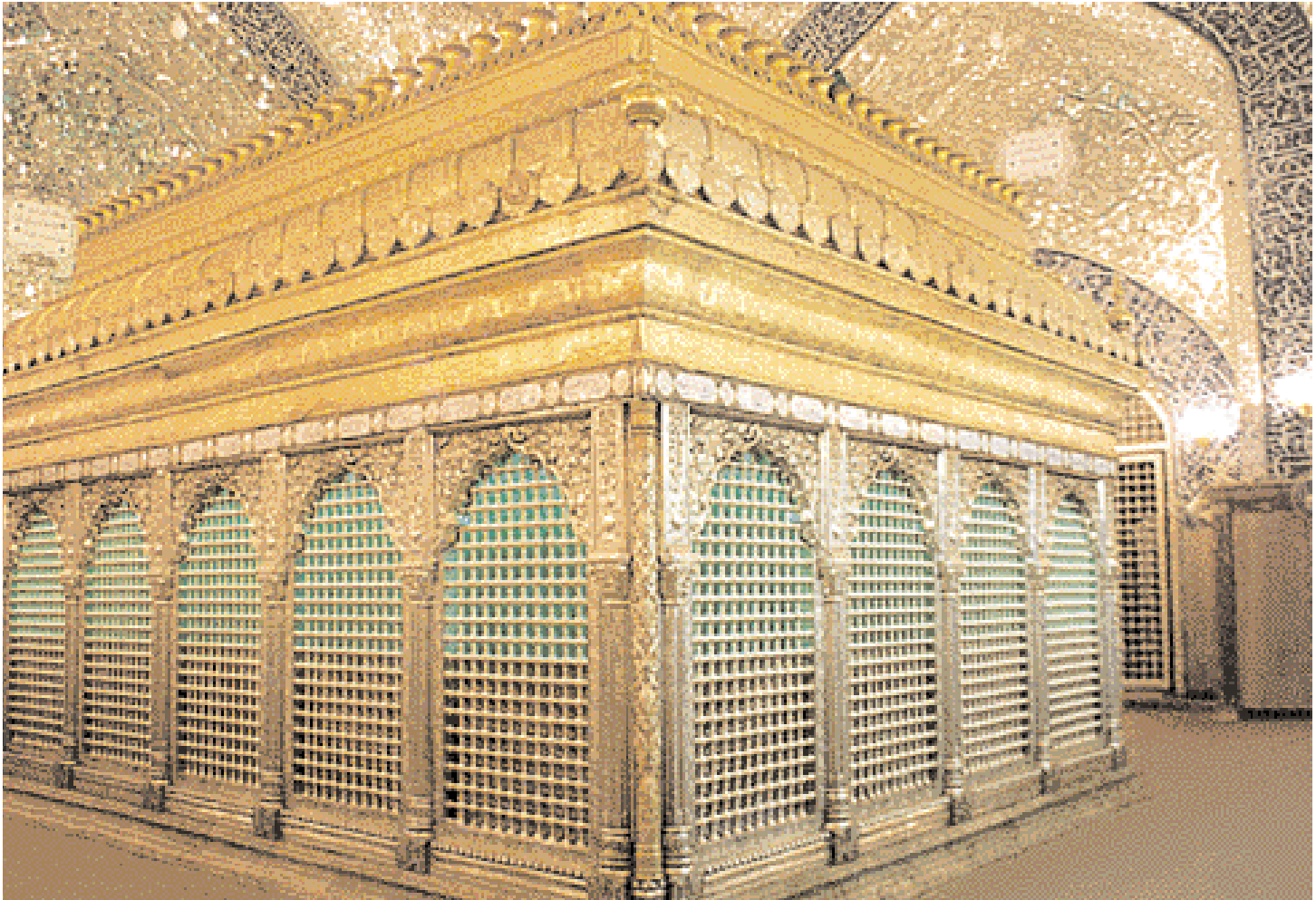
Inside the shrine.

تقع هذه المدينة جنوب غرب العاصمة بغداد وعلى بعد 160 كم وعلى حافة الهضبة الغربية من العراق