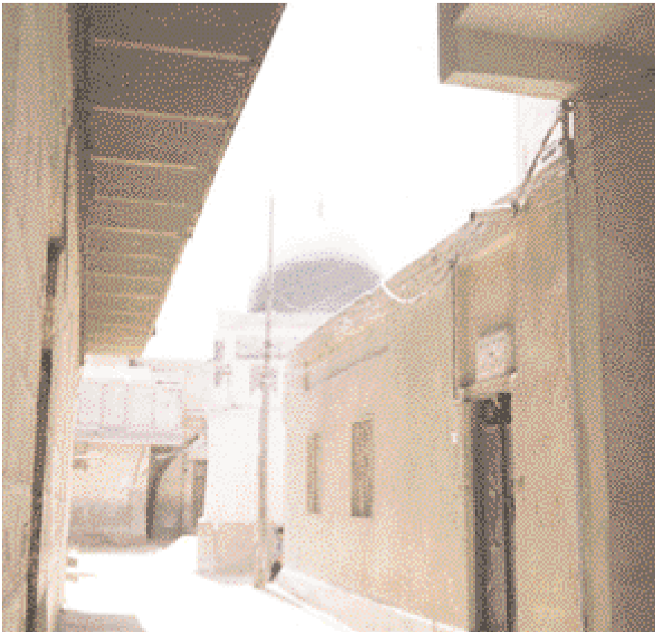
An alleyway in the old town.

ومن أحدث المكتبات في النجف الأشرف "مكتبة أهل البيت العامة" في سوق الحضّر والتي افتتحت عام 1993م وحتوي على بعض المخطوطات ولعل أقدمها يعود تاريخها إلى أكثر من 500 سنة، ومنها كتاب "زبدة الأصول"، بالإضافة إلى احتوائها على خزانه كبيرة ←