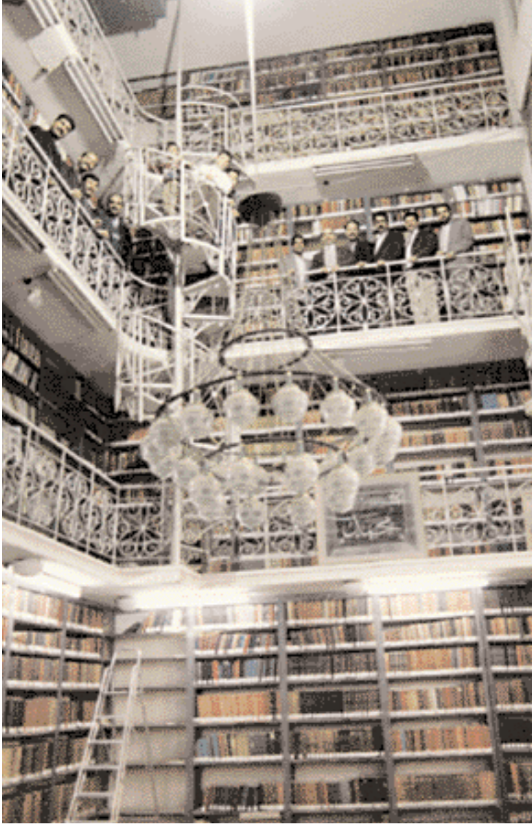
The Amir Al-Muminin library.