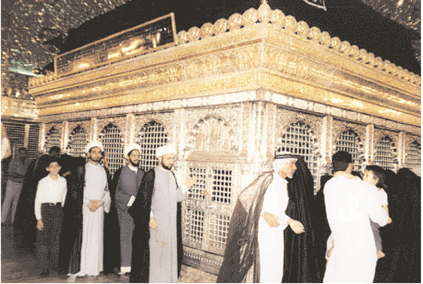
Inside the shrine.