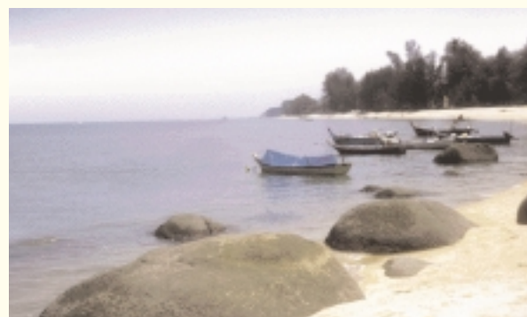
Der Ferringhi Strand