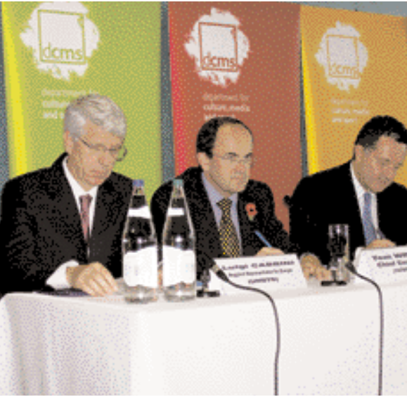
Speakers at the WTM's Tourism & Sports Seminar. المتحدثون في ندوة السياحة والرياضة