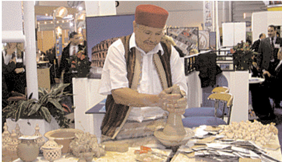
The Tunisian Stand