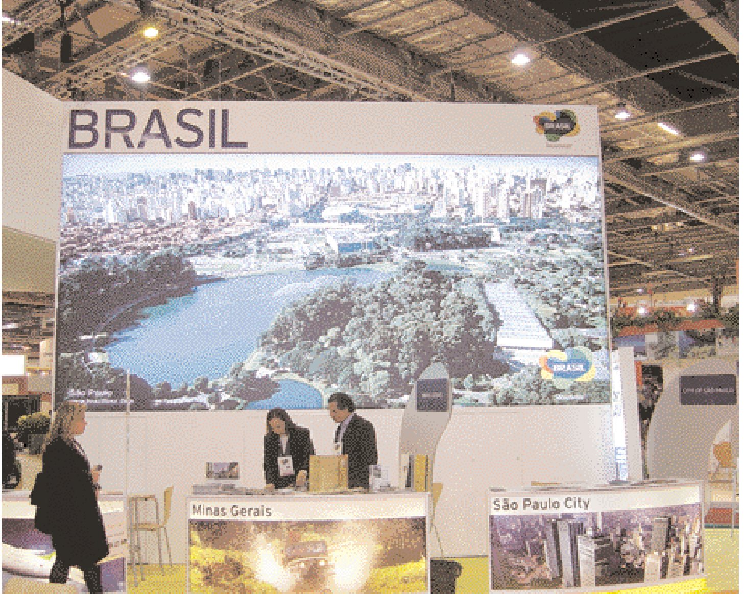
The Brazilian Stand