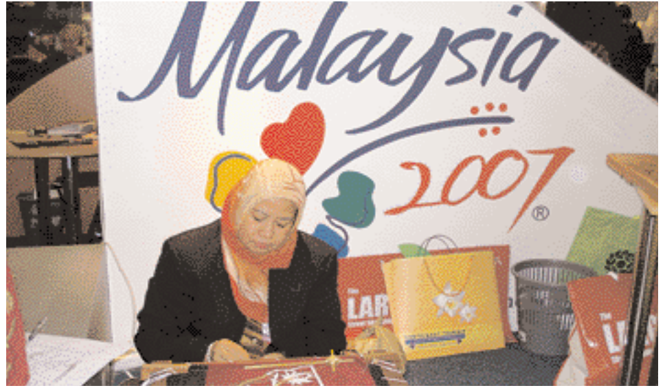
The Malaysian Stand