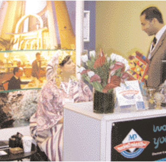
The Libyan Stand