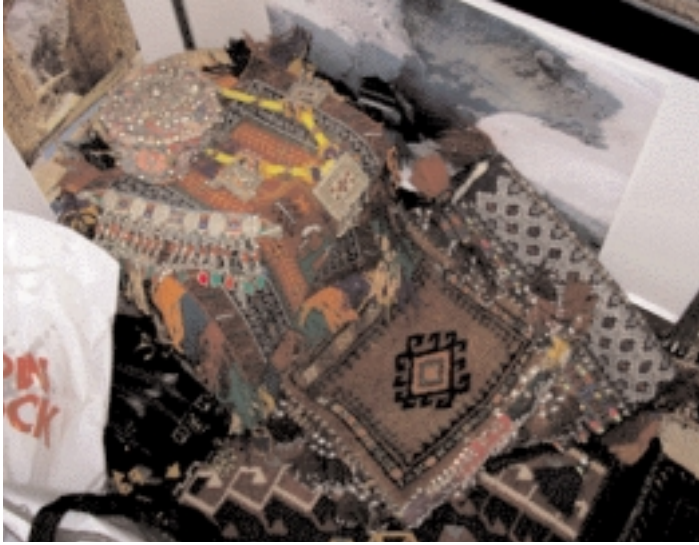
Afghan handicrafts on sale at the Hinterland Travel stand مصنوعات يدوية أفغانية في جناح وكالة هنترلاند السياحية