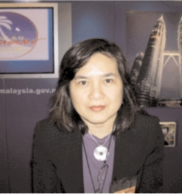
The Malaysian stand