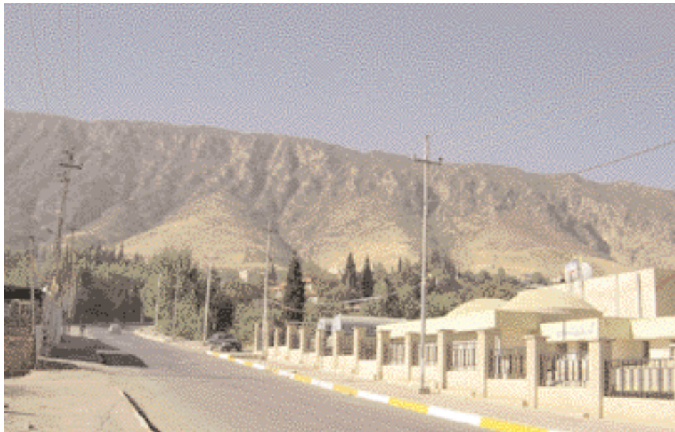
The road to Shaklawā resort

بسبب بعده نسبيا، كما أن وجود العديد من المصايف القريبة قد تغني البعض عن التوجه إلى هذا المصيف، لذلك فإن معظم من يزوره هو لغرض الاستشفاء. إن من يروم زيارة العراق، عليه أن يجعل من زيارة إقليم كردستان وتحديدا عاصمته أربيل، إحدى أولوياته، حيث إن جميع أنواع السياحة ومقوماتها يمكن أن تجدها في هذه المنطقة، وأولها الأمان، وما سوف تشعر به من راحة البال والاستمتاع بجمال الطبيعة البكر، والتي لم تتغير أبدا بفعل عوامل الزمن. ■