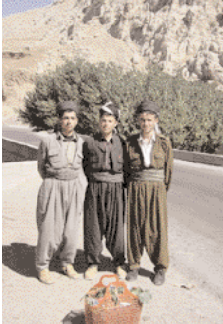
شباب بزيمهم الكردي التقليدي Youth in their local costume