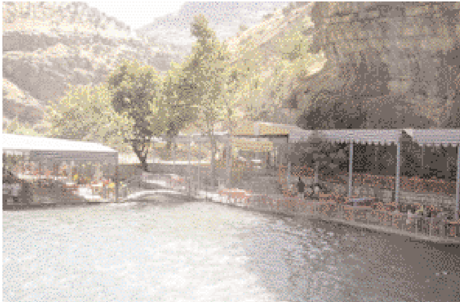
أسواق مجاورة لشلال بيخال Market near Bikhal waterfall

تحتوي هذه القلعة أيضا على حمام هو من المواقع الأثرية فيها، حيث يرجع تاريخه إلى القرن الثاني عشر الميلادي، إلا أنه جدد في 1775م