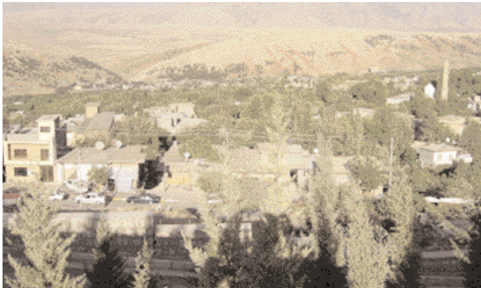
Shaklawā resort from the top of the surrounding mountain