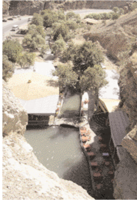
حوض شلال كلي علي بك Kali Ali Bek Waterfall

كردستان، وأهم المواقع السياحية في العراق، حيث تعتبر من المناطق النادرة في العالم، التي تتوفر فيها جميع مقومات السياحة، وبمختلف أشكالها وأصنافها، لما تتمتع به من جمال طبيعة، وجبال ساحرة، واعتدال في درجات الحرارة، ولا سيما في فصل الصيف، فضلا من أن الثلوج تغطي الكثير من قممها في فصل الشتاء، والتي يستمر بعضها دون ذوبان حتى الشتاء الثاني مثل قمة "سري حسن بك" وسلسلة جبال حصاروست.