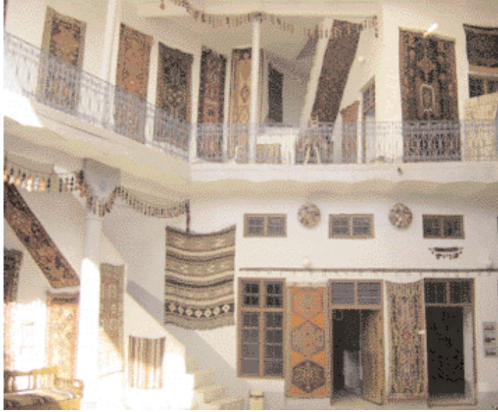
The museum inside the castle