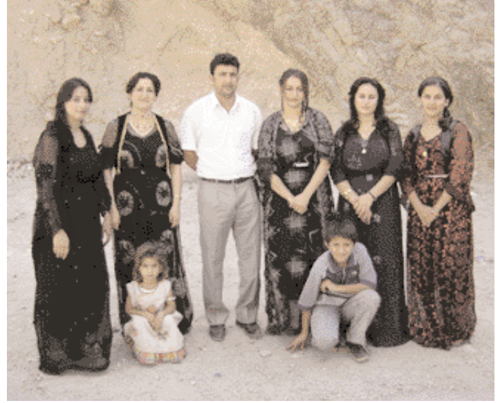
A kurdish family in their local costume