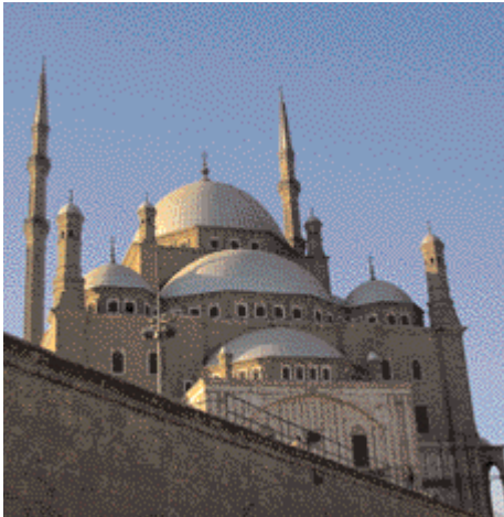
Mohammed Ali Moschee Kairo جامع محمد علي/القاهرة