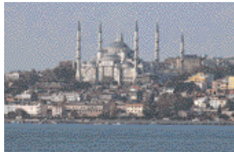
Blick über den Bosphorus تركيا

Standpunkte kennen, um das Thema ohne Verwirrung erklären zu können.