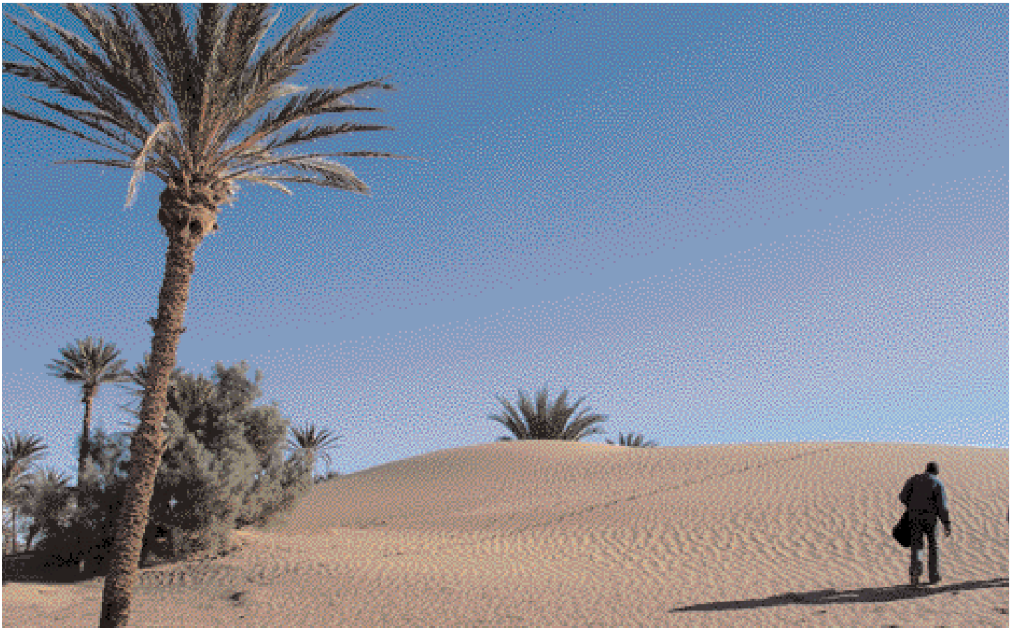
Von Mhamid in die Wüste