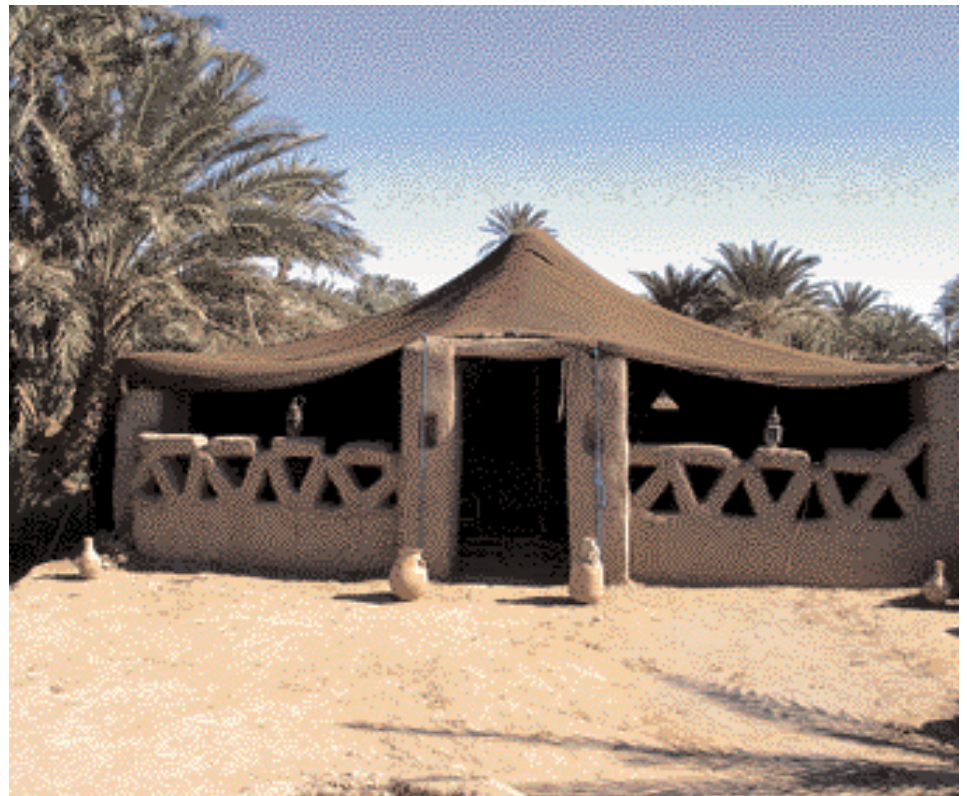
Die Oase von Mhamid