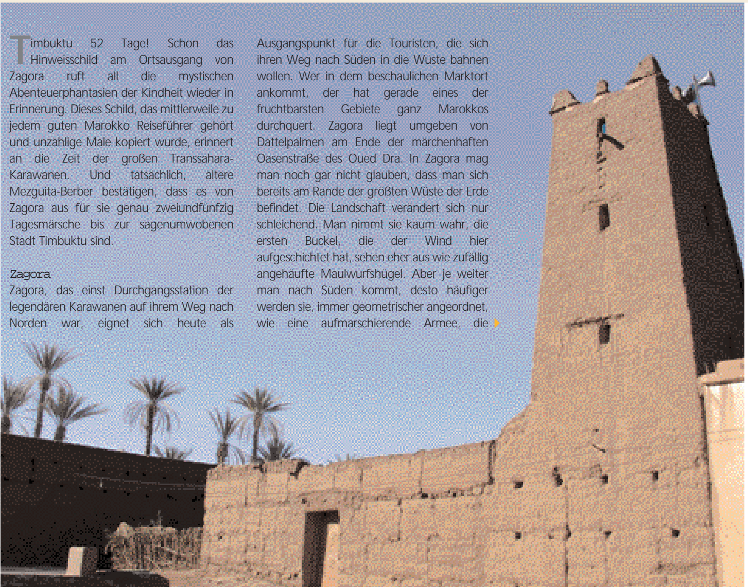
Traditionelles Berberhaus (kashbah)

Ausgangspunkt für die Touristen, die sich ihren Weg nach Süden in die Wüste bahnen wollen. Wer in dem beschaulichen Marktort ankommt, der hat gerade eines der fruchtbarsten Gebiete ganz Marokkos durchquert. Zagora liegt umgeben von Dattelpalmen am Ende der märchenhaften Oasenstraße des Oued Dra. In Zagora mag man noch gar nicht glauben, dass man sich bereits am Rande der größten Wüste der Erde befindet. Die Landschaft verändert sich nur schleichend. Man nimmt sie kaum wahr, die ersten Buckel, die der Wind hier aufgeschichtet hat, sehen eher aus wie zufällig angehäuften Maulwurfshügel. Aber je weiter man nach Süden kommt, desto häufiger werden sie, immer geometrischer angeordnet, wie eine aufmarschierende Armee, die