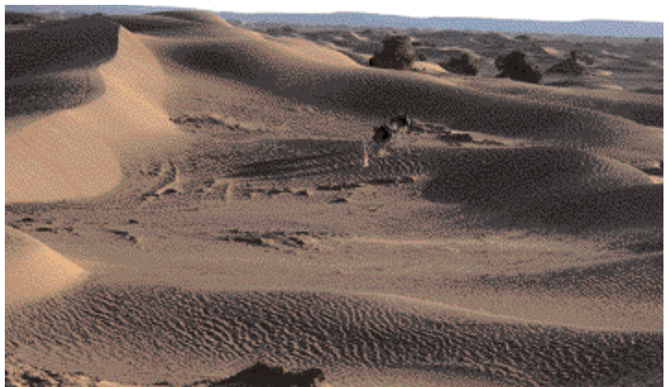
'Kleine Kamelkarawane' auf einer traditioneller Route