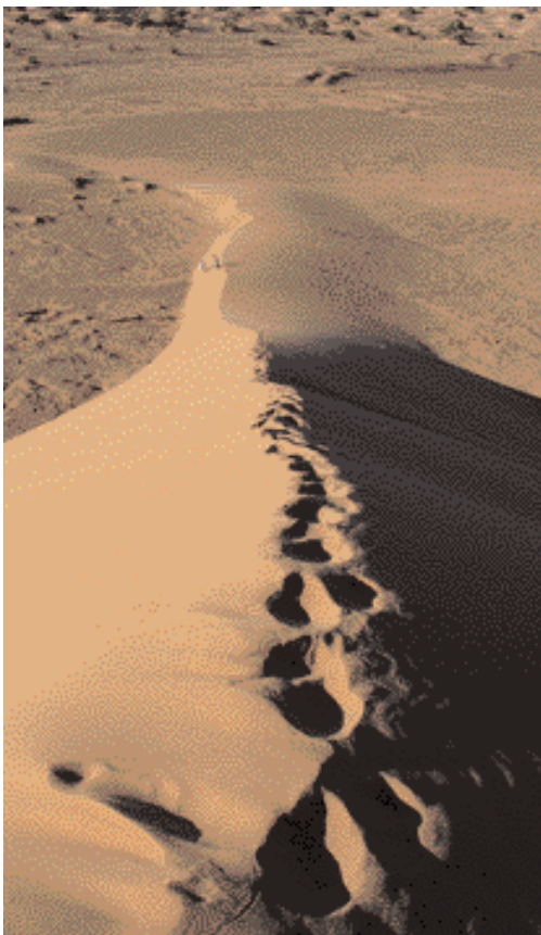
Spuren auf den Dünen Tinfous

führt, teilt die großflächige Siedlung in zwei Teile. Die Stadt war früher ein Zentrum für Nomaden und durchreisende Karawanen. Heute ist sie Ausgangspunkt für Kamelsafaris in die Wüste. Wer also in Zagora noch nicht seine Wüstenexpedition geplant hat, der findet auch hier noch ausreichend ▶