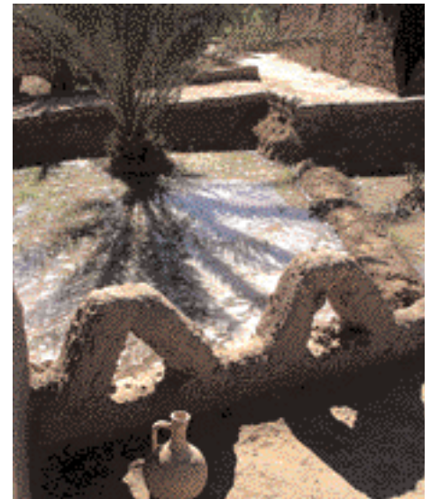
In der Oase von Mhamid

es hierher. Auf dem Weg dorthin erklimmen wir einen Inselberg, von dessen Gipfel sich uns einen grenzenloser Ausblick auf die umliegende karge Wüstenlandschaft bot. Und das besondere: An den Mauerresten konnte man erkennen, dass es auf der Kuppe einmal eine Stadt gab. Dieser einmalige Ort ist in keinem Reiseführer erwähnt. Nachdem meine Freunde aus unserem bescheidenen Gepäck wahres Festessen gezaubert hatten, erklimmen wir die mehrere hundert Meter hohen Sandrücken. Die Tinfou Dünen heißen in der Berbersprache auch goldener Sand. Es handelt sich um sehr schnell wachsende Winddünen inmitten einer pittoresken Felsenlandschaft. Dort verbrachten wir den Nachmittag. Während meine Begleiter das Zelt aufschlugen, hatte ich Gelegenheit ganz für mich alleine in den Sonnenuntergang zu blicken und die unendliche Ruhe dieses Ortes zu erleben. Auch die schönsten Bilder können diese atemlose Stille nicht transportieren. Man muss sie erleben. ■