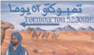
Straßenschild علامة على الطريق

So mancher Reisende ist zunächst enttäuscht, denn die Sahara besteht größtenteils aus Stein, Fels, Kies oder Geröll. Aber im äußersten Südosten Marokkos gibt es sie doch, die anmutigen goldgelben Dünenrücken, die unendliche Sandmeere formen. Diese Wüsten sind so, wie wir sie von all den mystischen Bildern und Filmen kennen. Und doch wieder nicht, den sie zu erleben, das ist noch einmal etwas ganz anderes – der gänzliche Verlust des Gefühls für Zeit und Raum. Die Sandmassen nehmen einem das Gefühl für Entfernungen und dämmen jedes Geräusch. Hier herrscht nichts als atemlose Stille.