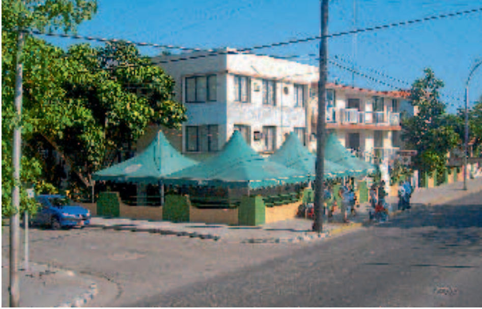
Along the Main Street