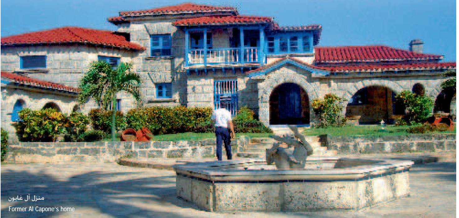
منزل آل غابون

ل شيء في هذا المنتج الذي تزوره حوالي 20000 نسمة موجه للزوار الأجانب الذين يعرض لهم بعض خيرة المنشآت السياحية، مما يجعله عالما لا يمكن للكوبيين إلا أن يحلموا به. هذا هو جوهرة التاج للشواطئ الكوبية التي يبلغ عددها 290 شاطئاً، وهو يشكل منتجعا سياحيا ذي عناية خاصة. فاراديرو هو المصدر الرئيسي للبلاد من العملات الأجنبية والحكومة حريصة على الاهتمام بالسياح