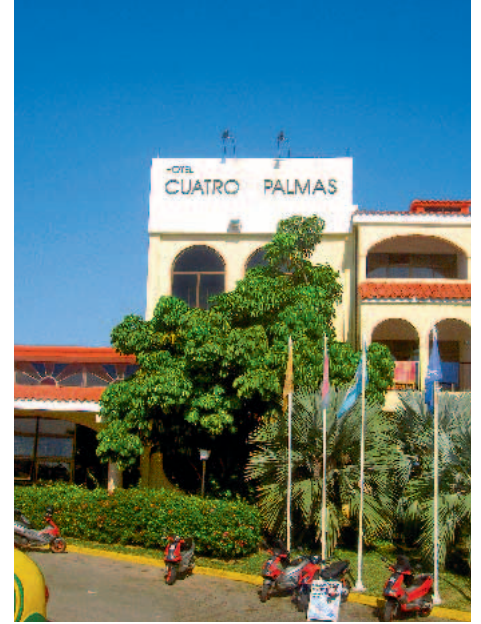
Cuatro Palmas Hotel

بضاهيها في جميع أنحاء نصف الكرة الغربي. لقد كان هذا المنتجع ذات مرة حصرا على المليونيرات، مثل دوبونتز الذين حظروا على الكوبيين العاديين الإقتراب من الشاطئ، ولكن المنتجع اليوم هو تقريبا حصر على الآلاف من السياح. لقد ذهبت الأيام التي كان فيها واحد من أكبر زعماء المافيا الأمريكية مستشارا لباتيستا، الديكتاتور الذي حكم البلد لزمّن طويل وبنى مع رفاقه والغوغاء التي تسانده فيلا فاخرة على شاطئ فاراديرو. وقد تم تحويل الفيلا المدهشة إلى موقع سياحي مع ملعب للغولف ذي 18 حفرة. غالبية السياح الذين يسافرون إلى فاراديرو هم