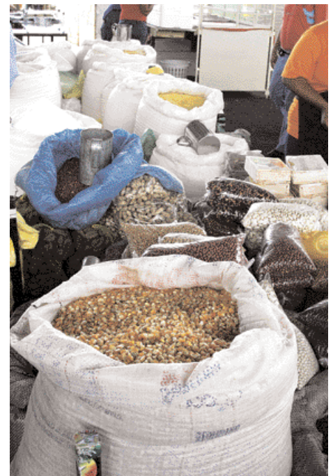
Brasilianische Bohnen und Nüsse جوز برازيلي