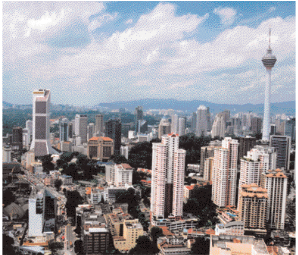
Die Kuala Lumpur-Skyline

Weitere Informationen über Kuala Lumpur und Malaysia finden Sie auf der Website http://www.tourismmalaysia.de .