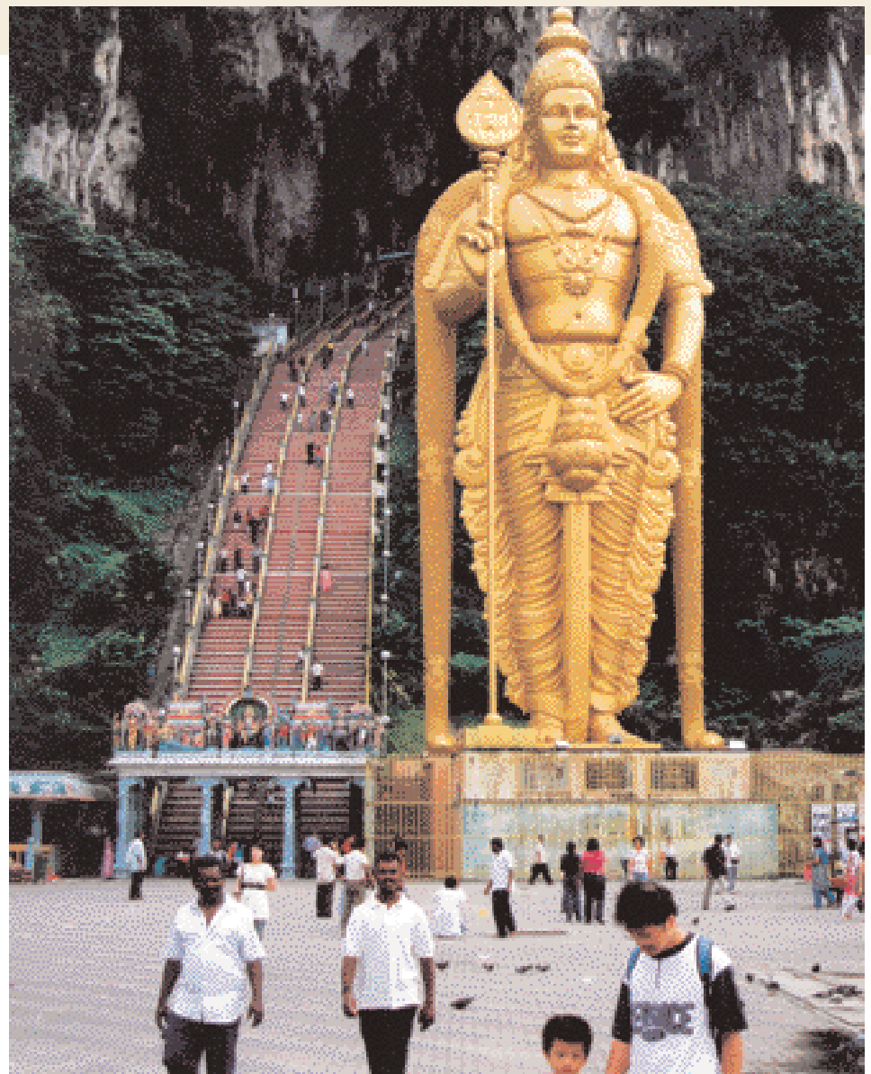
Die Batu Höhlen

Noch weiter nördlich, in der Nähe der thailändischen Grenze liegt die Insel Langkawi. Hier gibt es wunderschöne Strände und einmalige Klippenformationen, die steil aus dem Meer ragen. So etwa muss das nahegelegene Phuket ausgesehen ▶