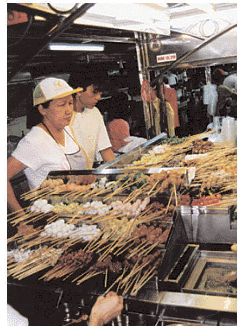
Köstlichkeiten an der Straße