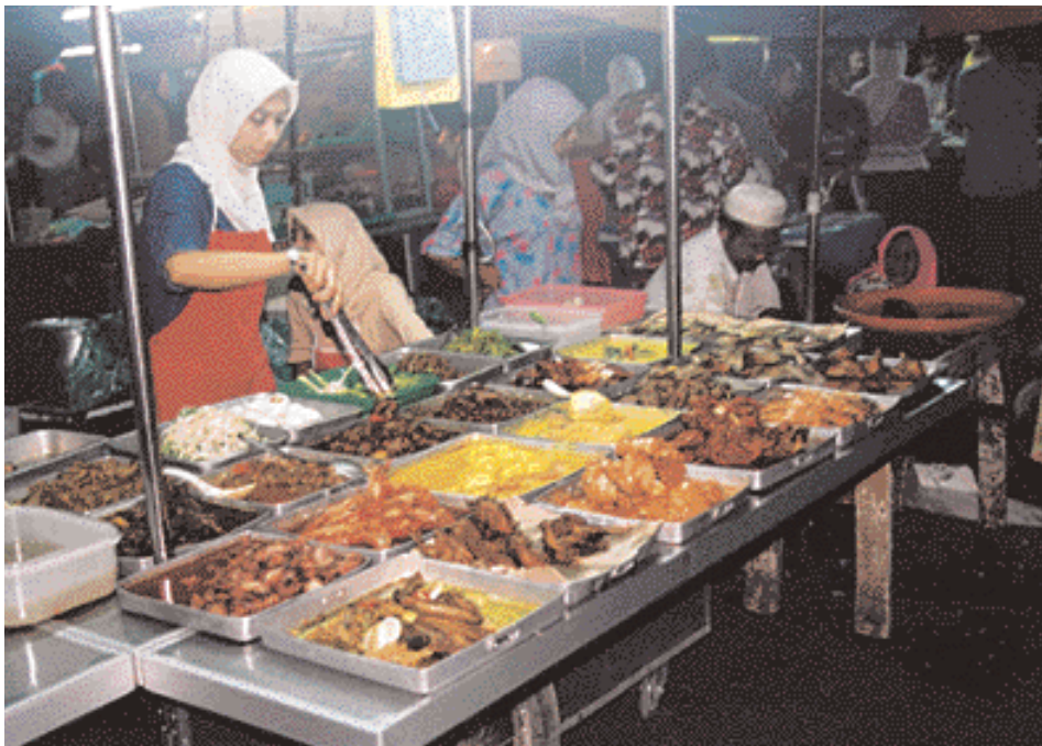
Muslimischer Essensstand in Kelantan