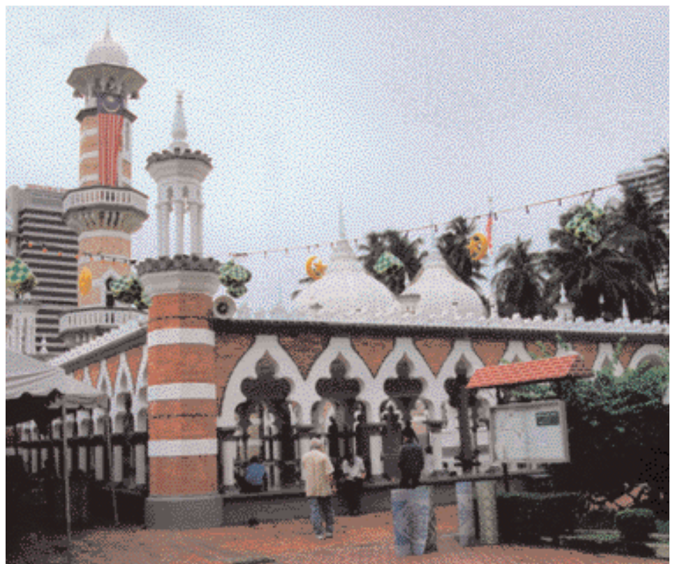
Die Moschee in Kuala Lumpur