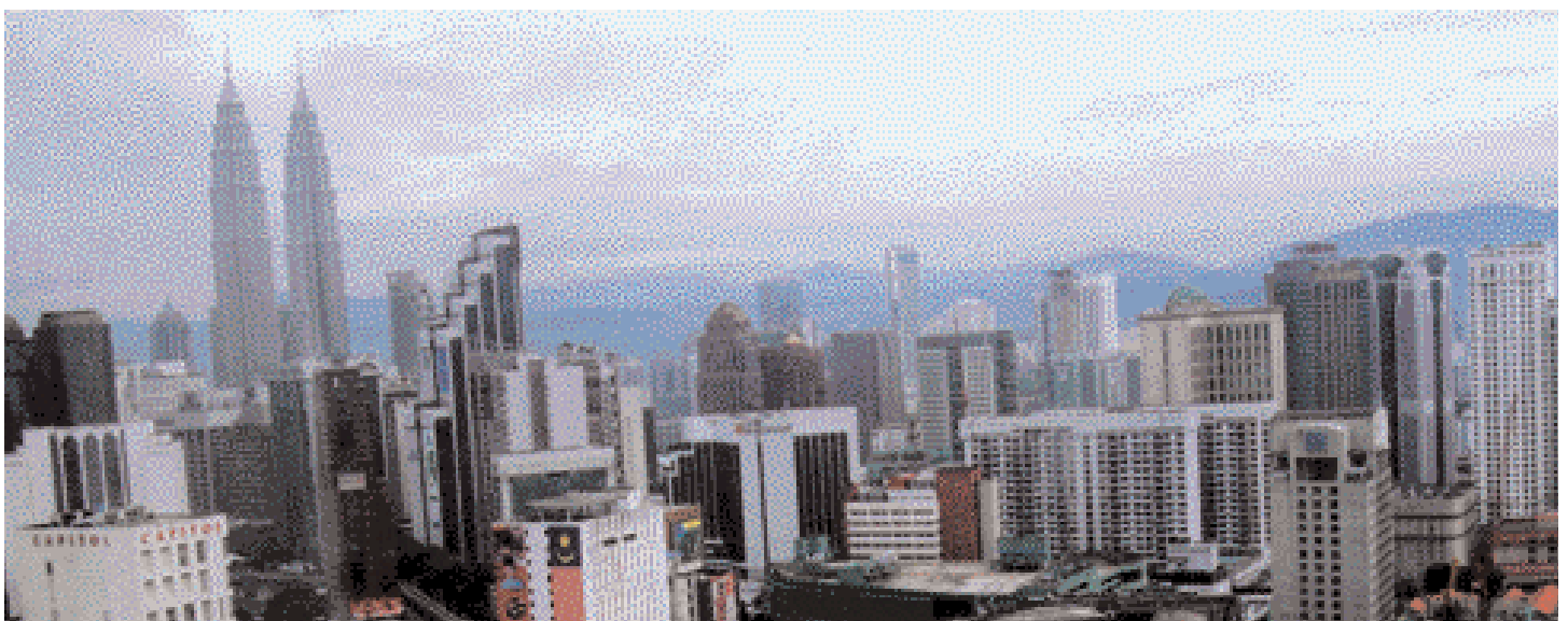
Die Kuala Lumpur-Skyline