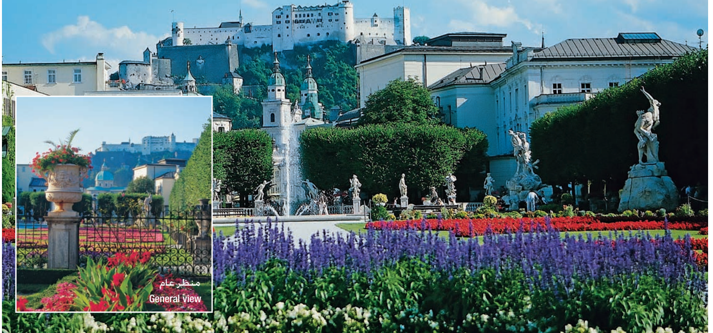
Salzburg Cathedral and Hohensalzburg Fortress

يمكنكم حضور المهرجانات الموسيقية في الصيف. وهي الأشهر في العالم. حيث يعود تاريخ الموسيقى في سالزبورغ لأكثر من 1200 عام. وصلتها عصرا بالقطار من مدينة "فيينا" حيث استغرق الطريق ثلاثة ساعات. محطة القطار منظمة وترتبط كافة مدن النمسا. كما أنها تربط مدن أوروبا. وذلك لموقعها المتوسط. سيارات الأجرة بانتظار السياح والذين يزيد عددهم سنويا عن 8 مليون سائح من مختلف