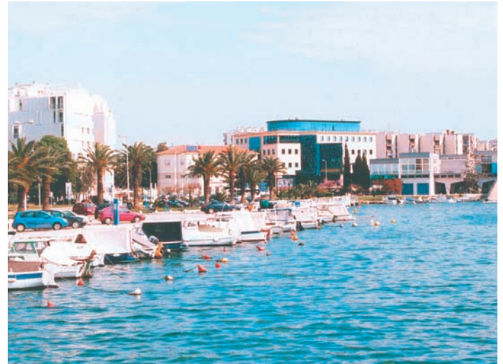
Zadar, where Dalmatia begins