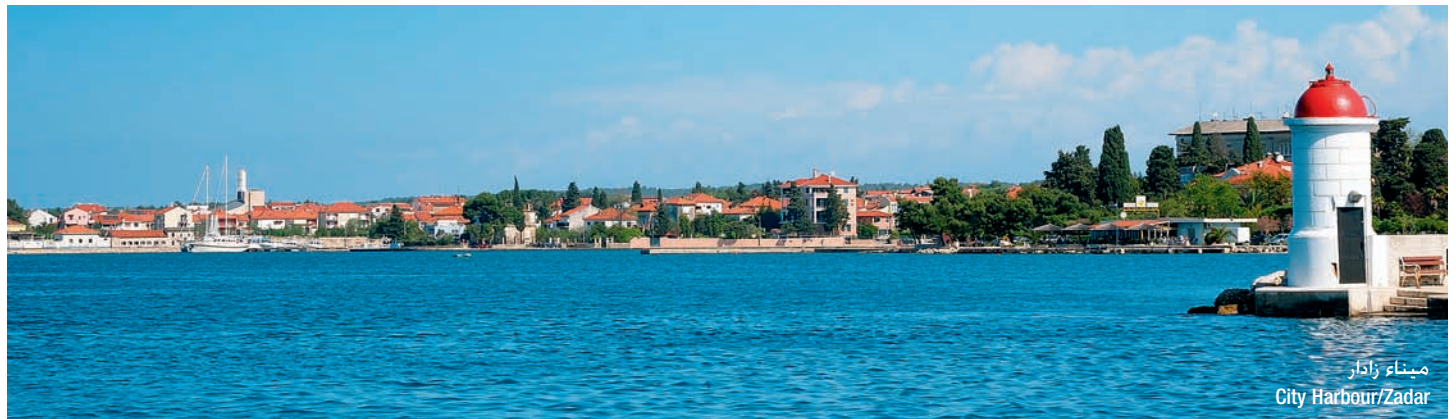
ميناء زادار City Harbour/Zadar