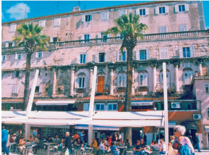
View of Split promenade