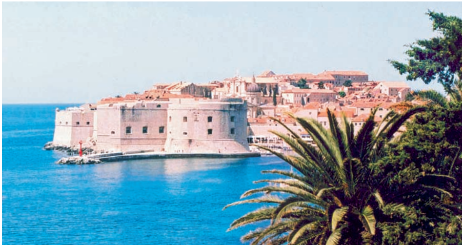
View of Dalmatian coast

بدأنا جولتنا في شمال العاصمة زغرب، محور الأعمال التجارية والمالية، وثمة تأثير جرمانى واضح هنا، بالقياس إلى نمط حياة البحر