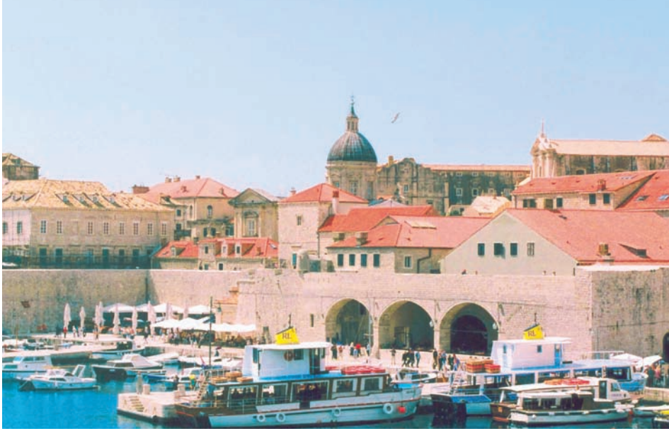
Walled City and harbour