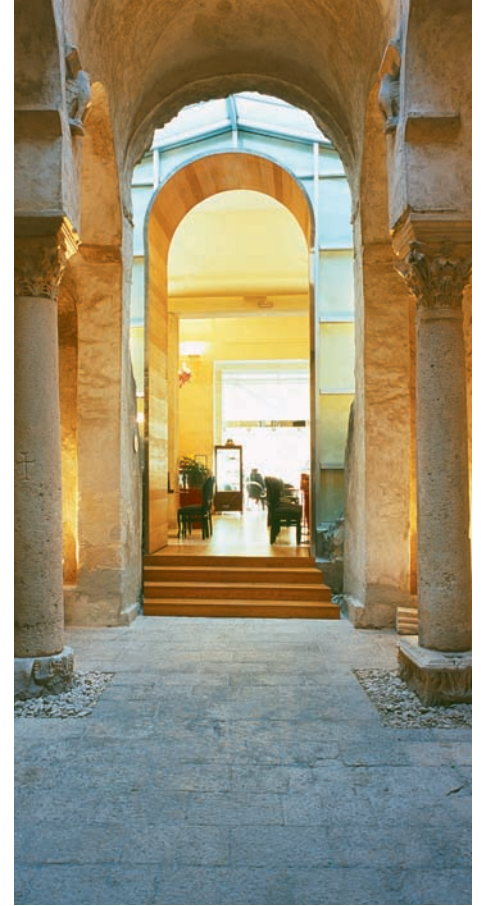
Café in Zadar