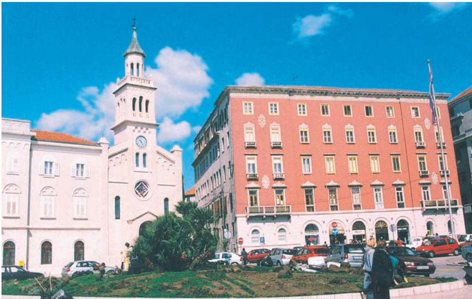
Old and new in Split