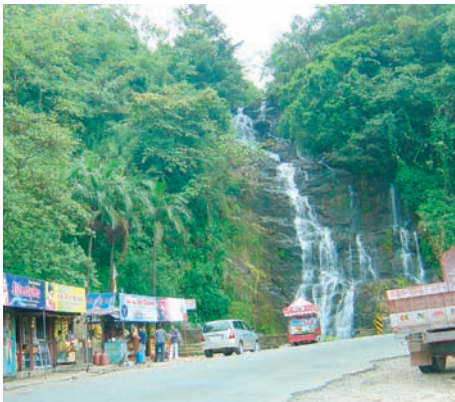
Hier wird gegessen