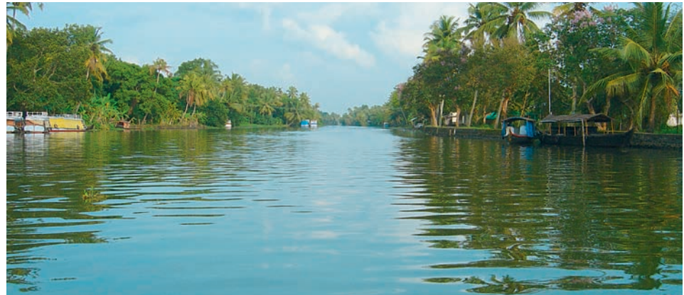
Leben am Fluss

mich zu sich nach Hause eingeladen. Wir hatten ein sehr leichtes Frühstück, bestehend aus Suppe. Nach dem Gebet kam die Hauptmahlzeit. Die Muslime Keralas haben viele reiche Traditionen: Willkommen in diesem gesegneten Land! ■