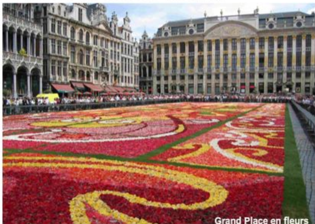
Grand Place en fleurs

À deux pas, on peut contempler la petite, mais également célèbre, statue de Manneken Pis qui représente un petit d'homme en train d'uriner.