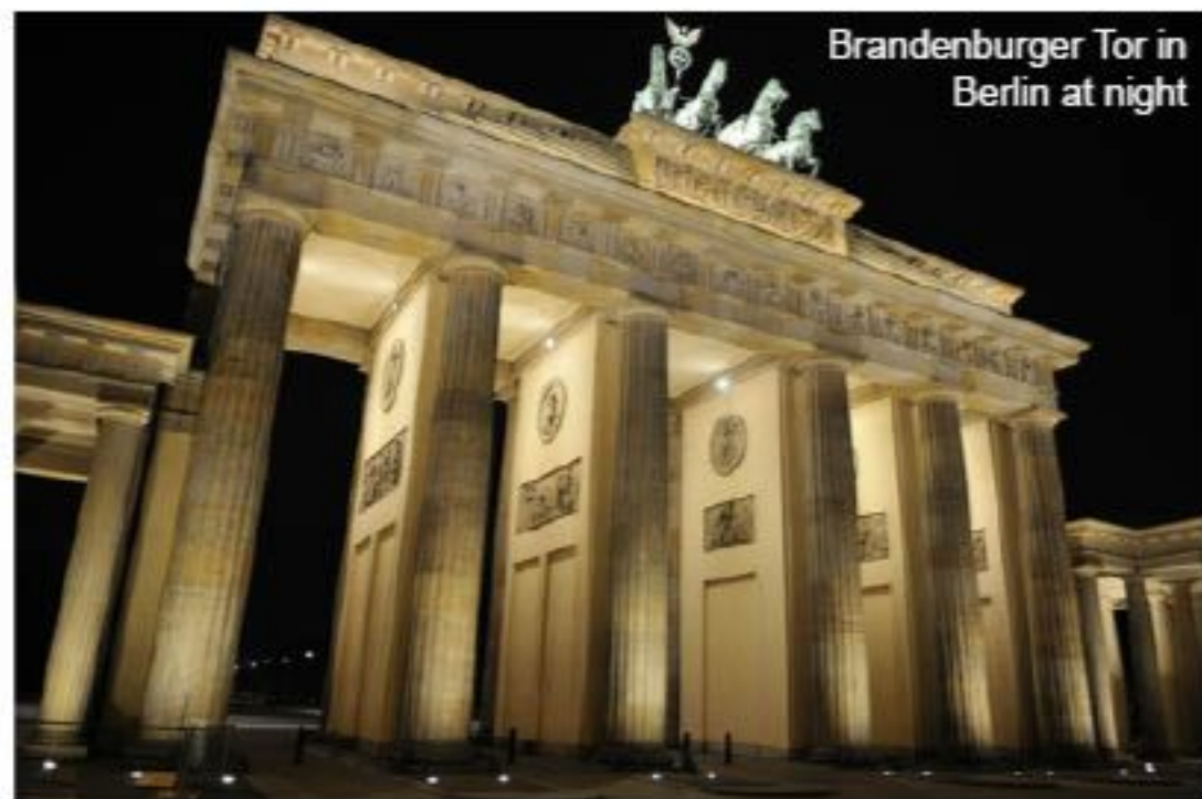
Brandenburger Tor in Berlin at night

secteur soviétique de la ville, nommé Berlin-Est, a été la capitale de la République démocratique allemande pendant que Bonn est devenu capitale de l'Allemagne de l'Ouest. Berlin est redevenue la capitale de l'Allemagne le 3 octobre 1990. Toutefois, le transfert du gouvernement et du chancelier à Berlin n'a eu lieu qu'en 1999, car il a fallu un vote tendu et très serré au Bundestag (parlement allemand) pour que la décision soit prise de transférer effectivement les institutions de Bonn à Berlin. Aujourd'hui, à