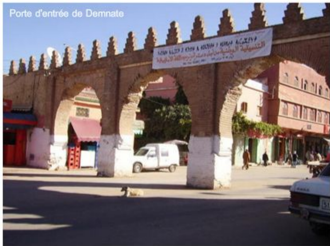
Porte d'entrée de Demnate

En été, ce site est la principale attraction touristique de la région. Les habitants locaux et les visiteurs y viennent pour se rafraîchir au milieu des petits bassins de l'oued