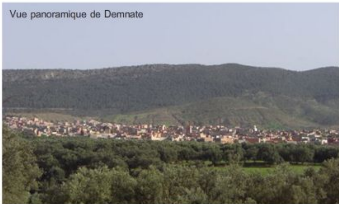
Vue panoramique de Demnate

Rattachée administrativement à la Région Tadla-Azilal (au centre du Maroc), Demnate est une ville typique du Dir (piémont atlasique), une belle cité au cœur d'oliveraies et de vergers verdoyants.