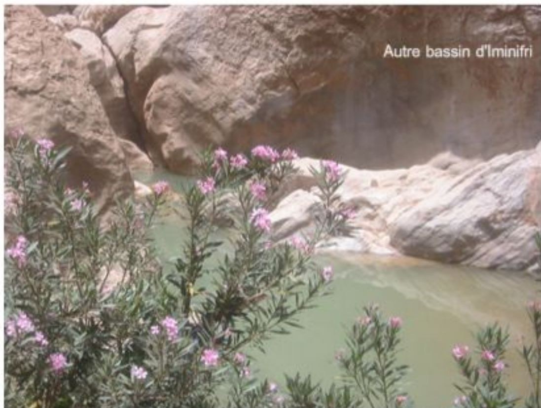
Autre bassin d'Iminifri

Située en retrait de la route reliant Marrakech à Béni Mellal, longtemps recluse en plein Atlas central, à près de 1000m d'altitude, à 100 km à l'est de Marrakech et à 140 km à l'ouest de Ouarzazate, Demnate était une importante cité commerçante, un centre d'un artisanat réputé de poterie, qui aurait pu avoir une évolution et un