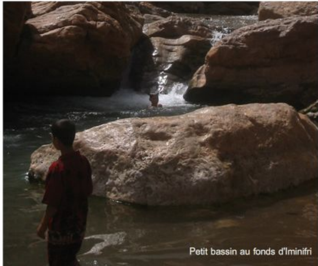
Petit bassin au fonds d'Iminifri

développement plus intéressants, vu son potentiel naturel et son histoire.