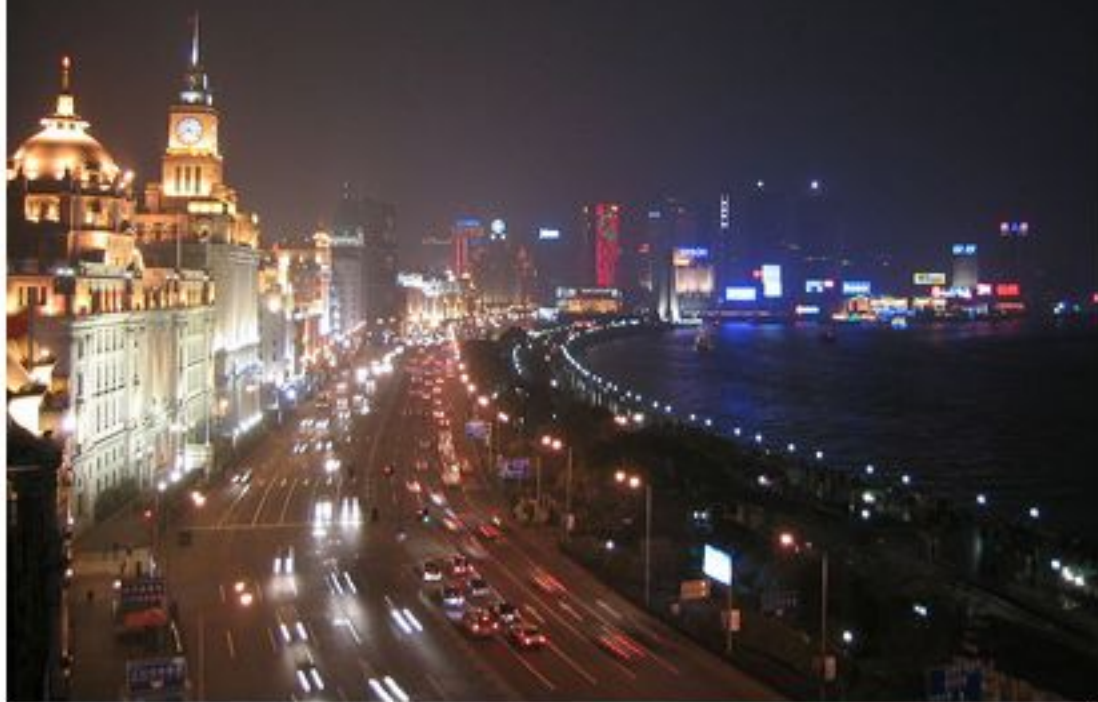
Shanghai at night