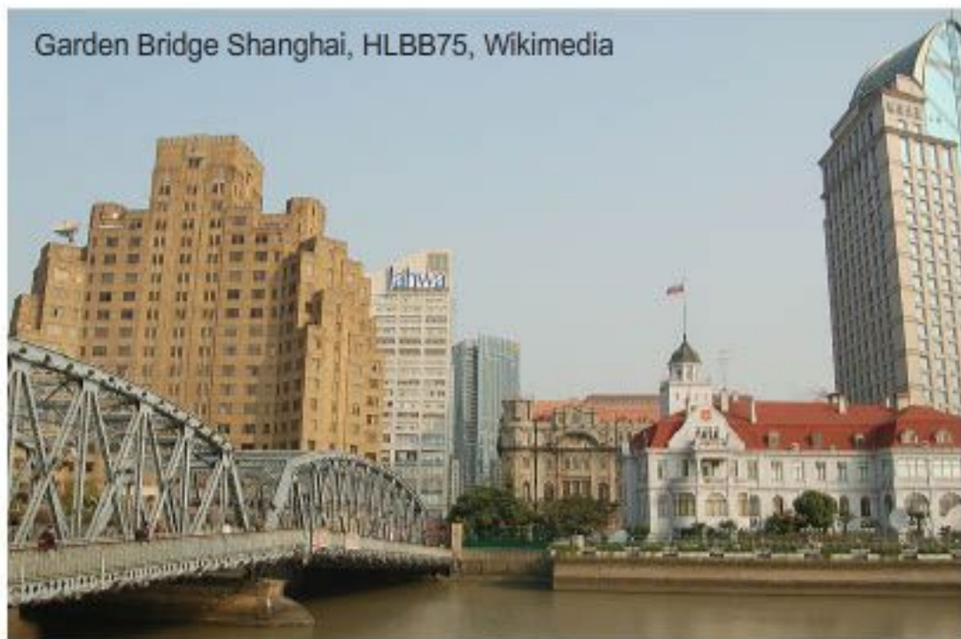
Garden Bridge Shanghai

À l'origine port modeste et village de tisserands, Shanghai ne semblait pas promise à pareil essor cosmopolite. Étant donnée sa situation stratégique à l'embouchure du Yangzi Jiang, au centre de la Chine, et la proximité avec des villes aux productions artisanales réputées (Suzhou, Hangzhou), Shanghai est devenue très tôt un centre d'échanges économiques importants.