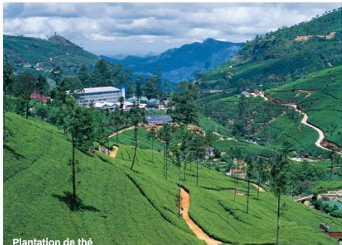
Plantation de thé

de remarquables reliefs sinueux sur lesquels sont répartis les trous. D'autres, englobent des parties splendides de monts et lacs, ajoutant un charme particulier à ces espaces. Le terrain de Victoria regroupe l'ensemble de ces avantages.