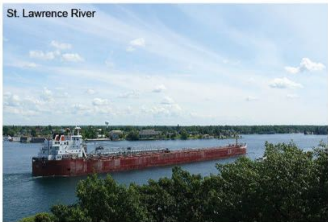
St. Lawrence River

Les personnes qui aiment voyager en famille, trouvent de plus en plus de services adaptés à leurs besoins. L'inventeur du concept de « prêt-à-camper » Huttopia a choisi les Parcs Nationaux du Québec pour y promouvoir son offre originale et peu coûteuse. Une opportunité de vivre le confort en nature. Cet été, il renforce sa présence sur place avec 50 nouvelles tentes qui accueillent les voyageurs depuis le 18 juin.