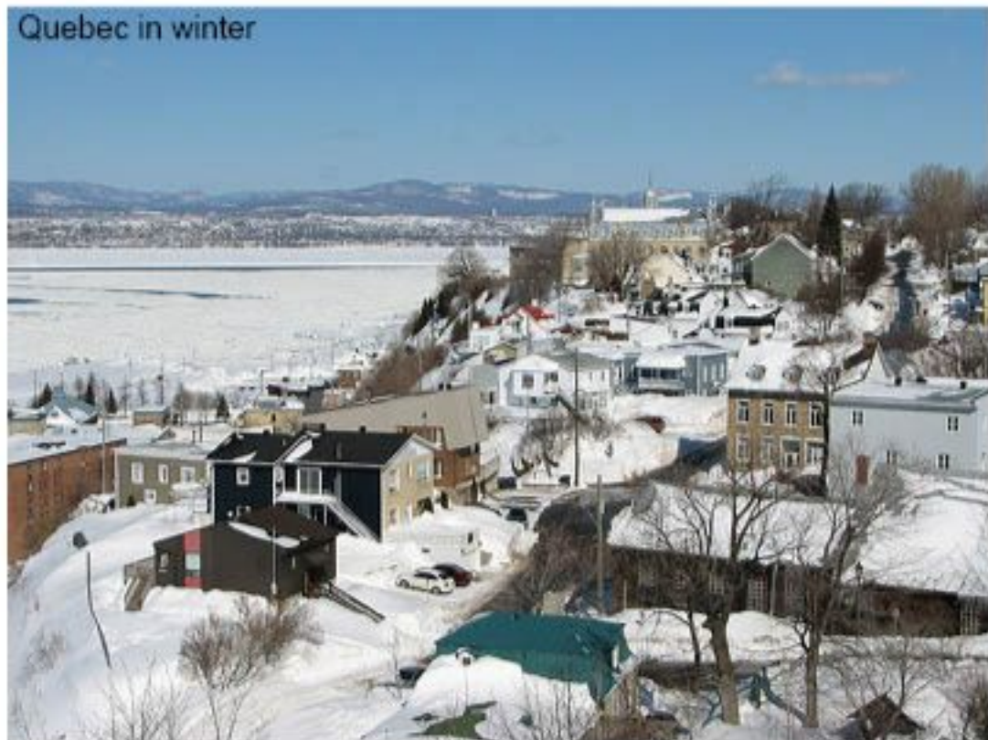
Quebec in winter