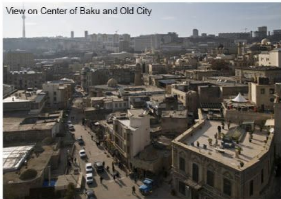
View on Center of Baku and Old City

La Conférence a désigné la ville de Najaf (Irak), capitale de la Culture islamique au titre de l'année 2012, pour la région arabe, et la ville de Sharjah (EAU), capitale de la culture islamique pour l'année 2014, pour la région