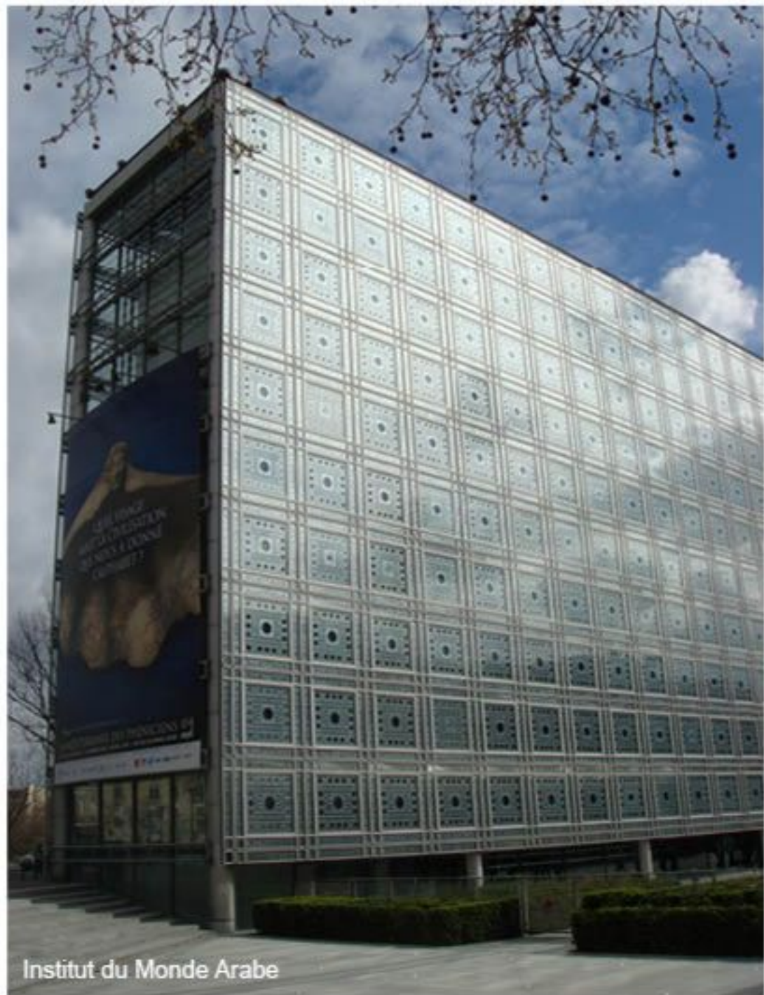
Institut du Monde Arabe