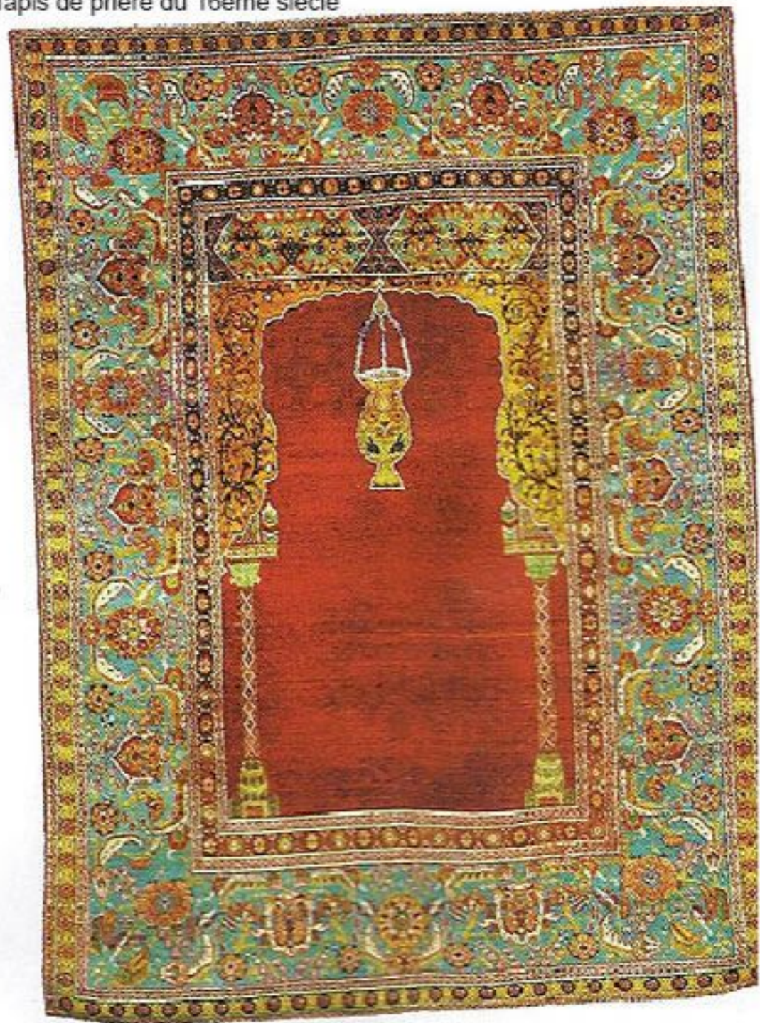
Tapis de prière du 16ème siècle