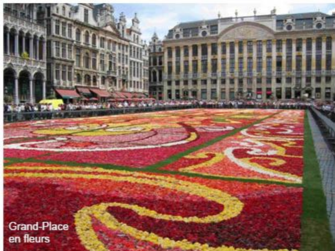
Grand-Place en fleurs

Bruxelles a su toutefois garder un caractère traditionnel issu de son passé flamand. En témoigne notamment le quartier de la Grand-Place, classé au patrimoine mondial de l'Unesco depuis 1998. Si Bruxelles est célèbre par la Grand-Place, Manneken Pis et les moules frites, son architecture locale offre un mélange subtil et inattendu de styles classiques et « Art Nouveau ». A tel point qu'elle peut se vanter de posséder les plus beaux monuments du genre,