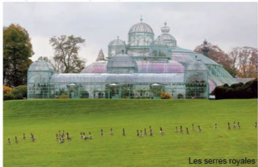
Les serres royales

Bruxelles, ville cosmopolite, est caractérisée également par la présence d'une forte communauté musulmane, composée essentiellement de Maghrébins et de Turcs. Ces derniers ajoutent au modernisme de la ville, les charmes des civilisations orientales.