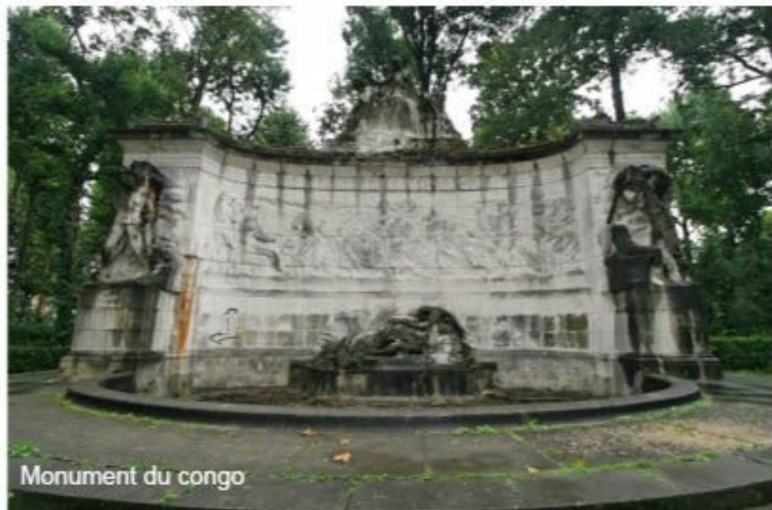
Monument du congo

successivement sous domination espagnole puis française.