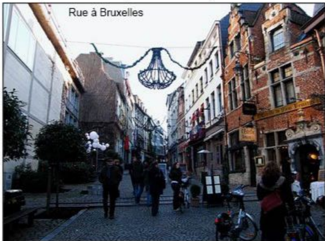
Rue à Bruxelles

agréablement aménagé. En le traversant, on aboutit au Palais Royal, résidence officielle de la famille royale belge.