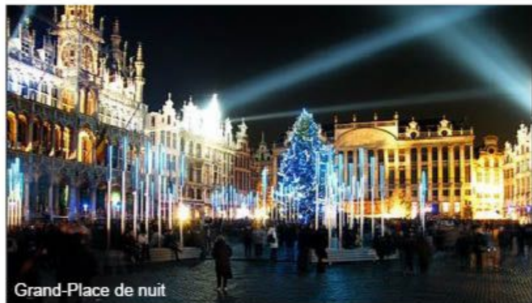
Grand-Place de nuit

soumise à la Réforme protestante, au même titre que les Pays-Bas, car tous deux formaient à l'époque un même empire. À cette époque également, Bruxelles fut