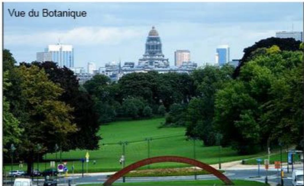
Vue du Botanique

Le nom de Bruxelles est connu partout dans le monde. Capitale de l'Union Européenne, Bruxelles occupe une position très visible sur la scène internationale. Ville européenne et cosmopolite,