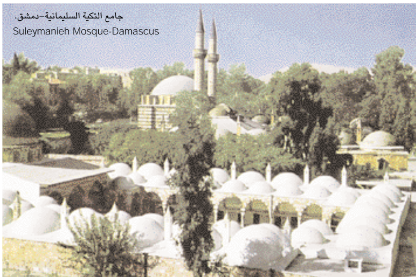
جامع التكية السليمانية-دمشق. Suleymanieh Mosque-Damascus

ومن حيث الثقافة فإن لسورية حركة ثقافية عامرة. حيث يمكنك الذهاب إلى المسح أو السينما أو المعارض الفنية والندوات والمحاضرات والقراءات الشعرية التي تجذب انتباه السائح المهتم. وبعض هذه الاهتمامات تتطلب معرفة باللغة العربية ويفضلها من له إلمام باللغة ولكن يمكنك الاستمتاع بقطعة فنية أو موسيقية من دون لغة خاصة سوى لغة الفن. ■