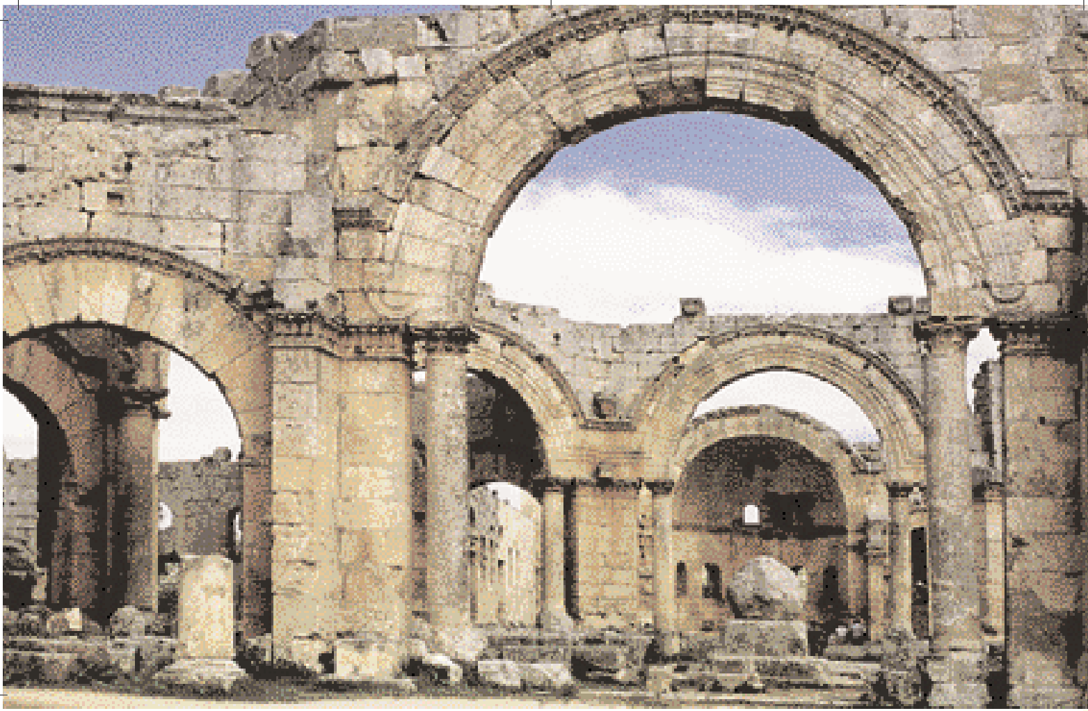
دير مار سمعان العمودي-محافظة حلب.

The Basilica of St. Simeon-Governorate of Aleppo.