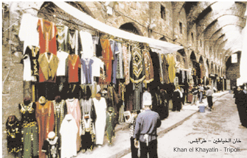
خان الخياطين - طرابلس. Khan el Khayatin - Tripoli.

ولصيда كثير من المعالم الأثرية الفينيقية والرومانية والصليبية والإسلامية. ومن فترة الصليبيين توجد "قلعة البحر" و"قلعة البر". ومن آثارها التي تعود إلى العهد العثماني "خان الفرخ" الذي بناه الأمير فخر الدين في بدايات القرن السابع عشر لاستقبال التجار والبضائع.