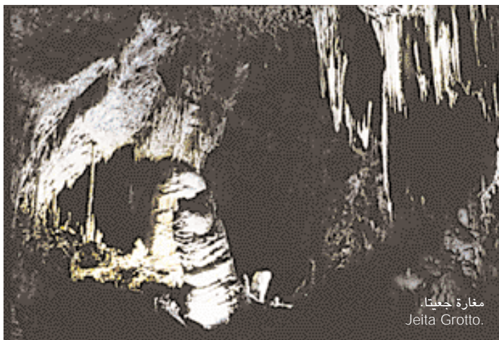
مغارة جعيتا. Jeita Grotto.

بنيت بيروت على موقع مدينة قديمة يعود تاريخها إلى حوالي خمسة آلاف سنة. ودخلت في القرن الأول قبل الميلاد تحت السيطرة الرومانية وكانت تعرف باسم "بيريتوس". وأصبحت في فترة قصيرة مقرا لمدرسة فقه دامت شهرتها حتى العصر البيزنطي. ولكن المدينة حُطمت على أثر كوارث ضربتها في عام 551 ميلادية، حيث اجتمع عليها زلزال عنيف وموج عات وحرائق لا تحصى.