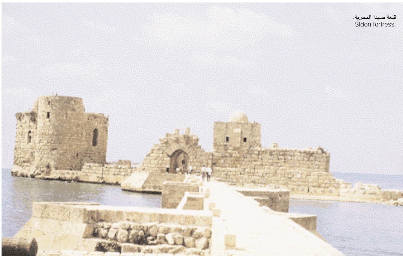
قلعة صيدا البحرية. Sidon fortress.

بنيت بيروت على موقع مدينة قديمة يعود تاريخها إلى حوالي خمسة آلاف سنة. ودخلت في القرن الأول قبل الميلاد تحت السيطرة الرومانية وكانت تعرف باسم "بيريتوس". وأصبحت في فترة قصيرة مقرا لمدرسة فقه دامت شهرتها حتى العصر البيزنطي. ولكن المدينة حُطمت على أثر كوارث ضربتها في عام 551 ميلادية، حيث اجتمع عليها زلزال عنيف وموج عات وحرائق لا تحصى.