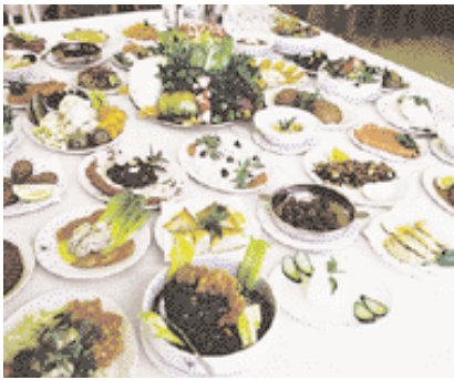
المطبخ اللبناني. Lebanese Cuisine.

التي يقع عليها الطلب الكثير، وأصحاب محلات الجوهرة اللبنانيون المهرة يصنعون قطعاً جميلة بسعر جيد.