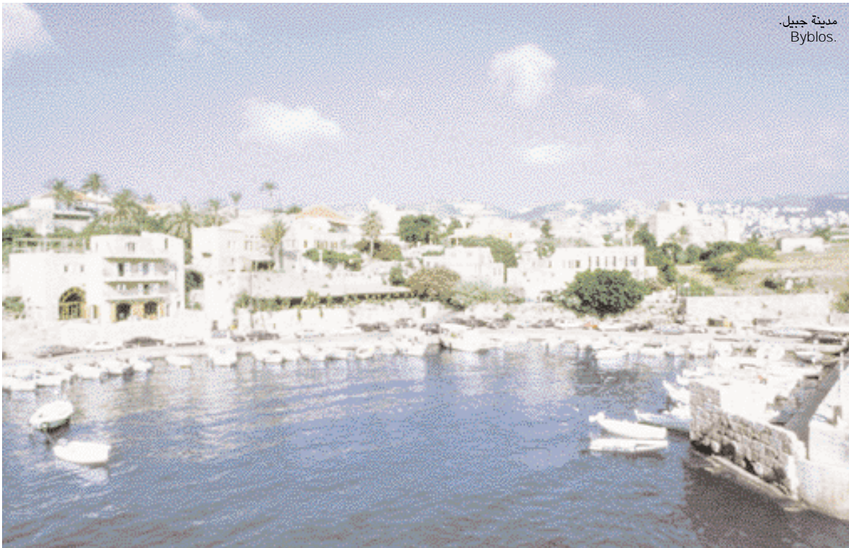
مدينة جبيل. Byblos.

في لبنان العديد من نوادي الصحة والألعاب الرياضية، فيمكنك أن تلعب الغولف، تنس أو سكواتش، سباحة،