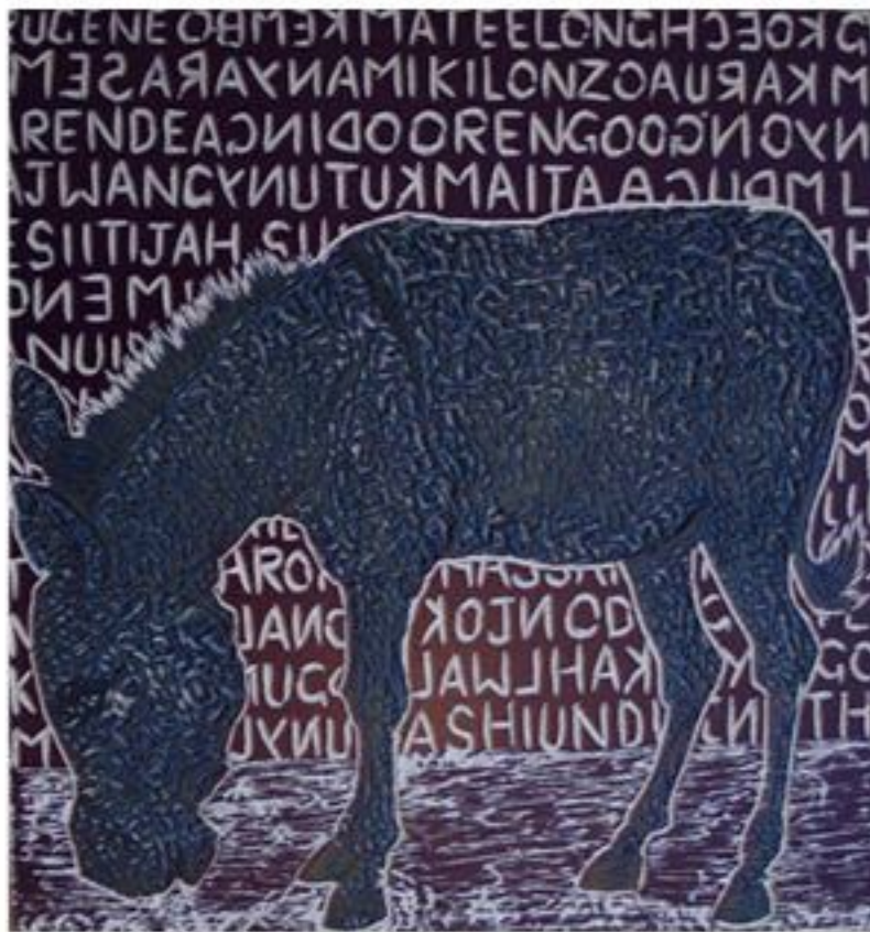
Le journal des objets volés 1 gravure sur bois 2009 43x41 cm

Dans ce travail, ces animaux deviennent des symboles pour les questions que se pose l'homme. Les moutons représentent les personnes dont les vies ont été altérées par des armes modernes. Dans la plupart des cultures, les moutons symbolisent le sacré et sont considérés comme doux, soumis et en partie sans défense. Dans les œuvres de l'artiste, les moutons marchent sur la terre jonchée d'icônes d'armes dont la