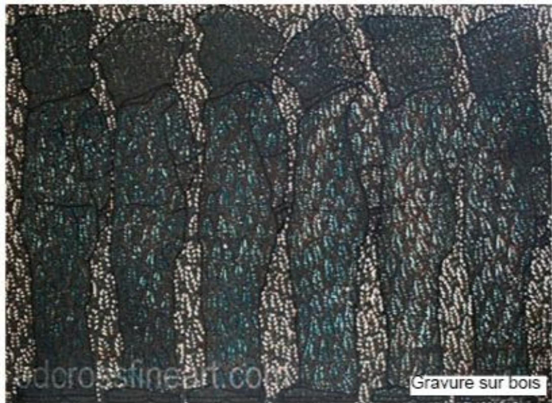
Gravure sur bois

pas être aligné en particulier sur la politique. Je ne veux pas me limiter à ce domaine ”.