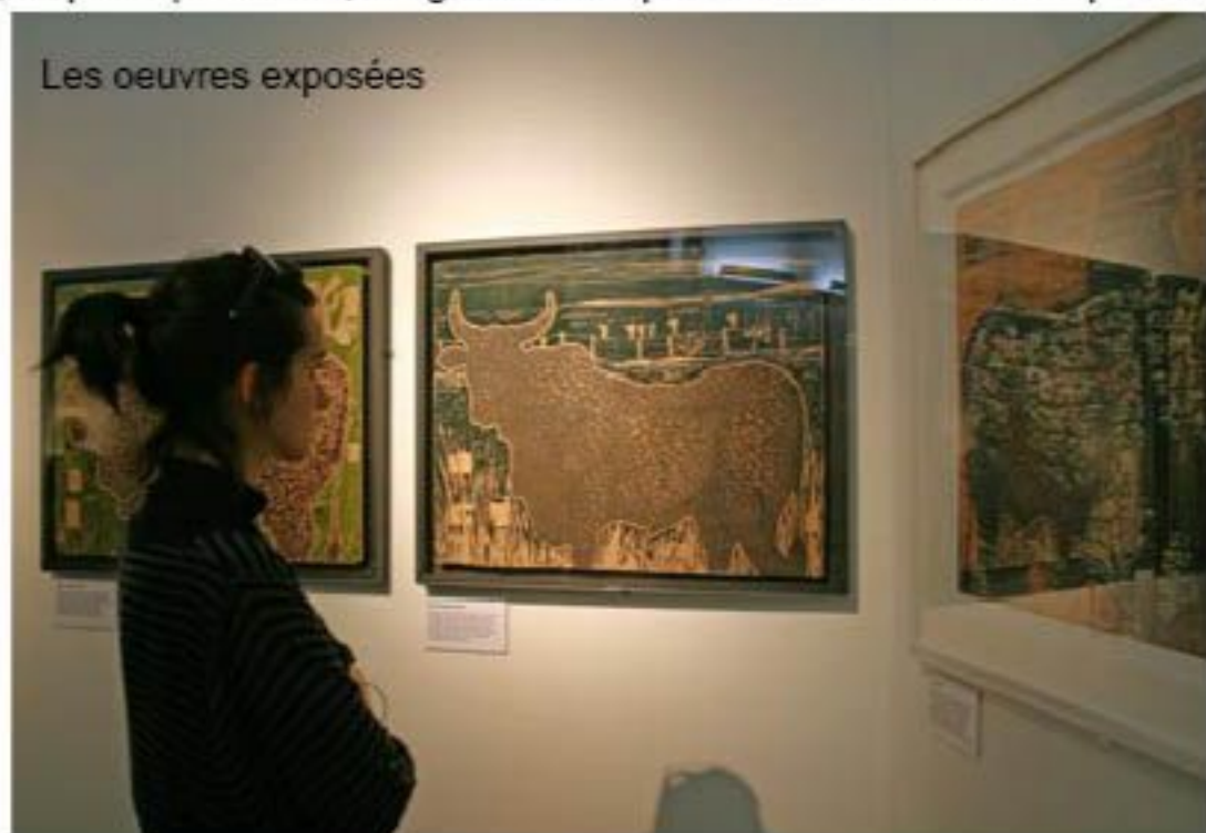
Les oeuvres exposées

Les gravures sur bois ont des sens à plusieurs niveaux. Il est possible d'apprécier les taureaux, les moutons et les ânes comme des œuvres d'art, habilement exécutés par un maître dans la gravure sur bois. Mais Kamwathi est convaincu que les êtres humains sont passés