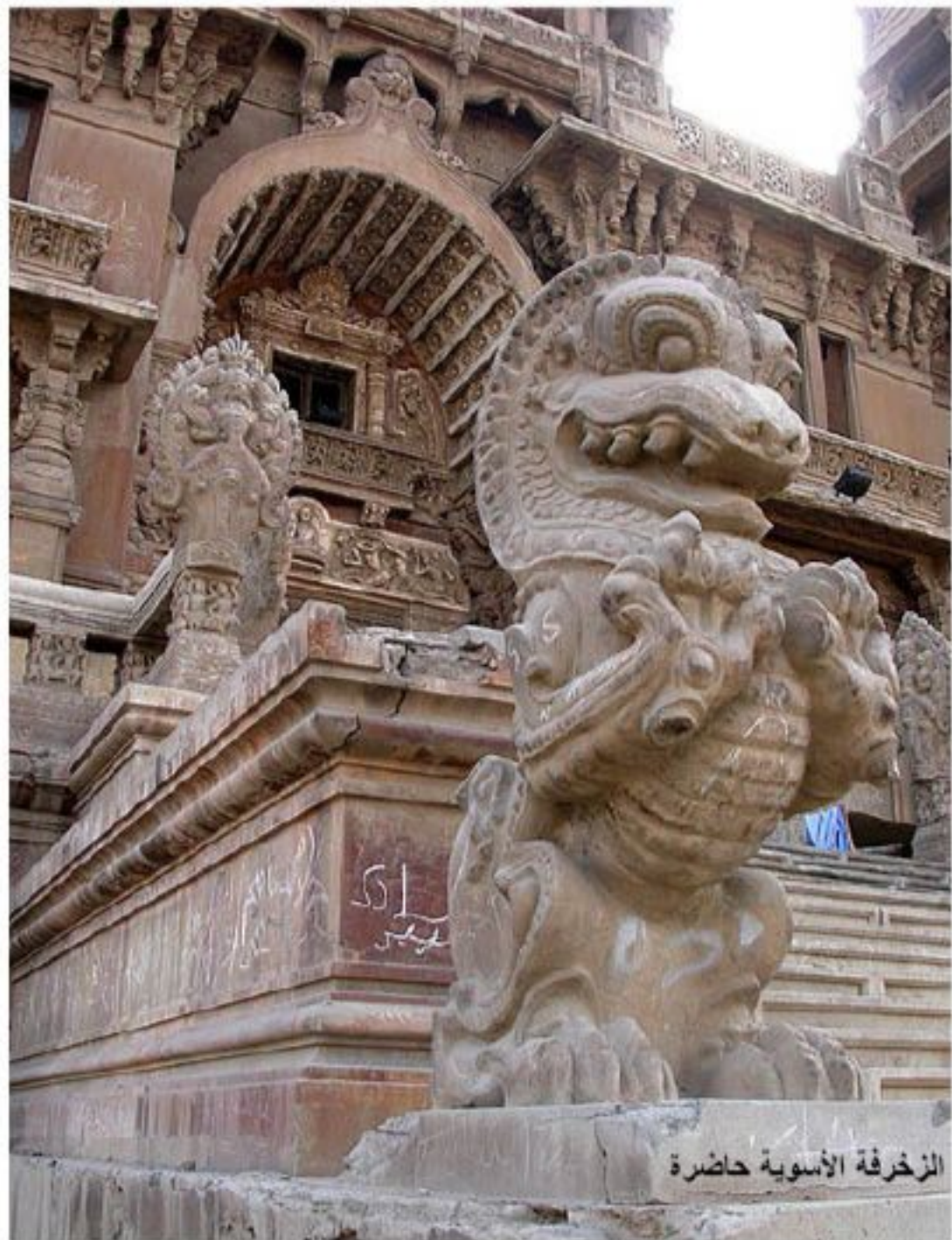
الزخرفة الأسوية حاضرة