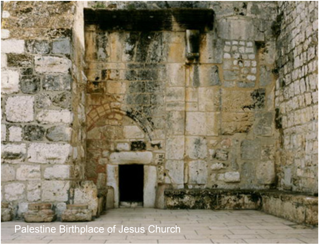
Palestine Birthplace of Jesus Church

(Chahar Ayyān) sur le pourtour de la cour ainsi que de deux coupoles exceptionnelles, la mosquée devint le prototype d'un style distinctif d'architecture islamique.