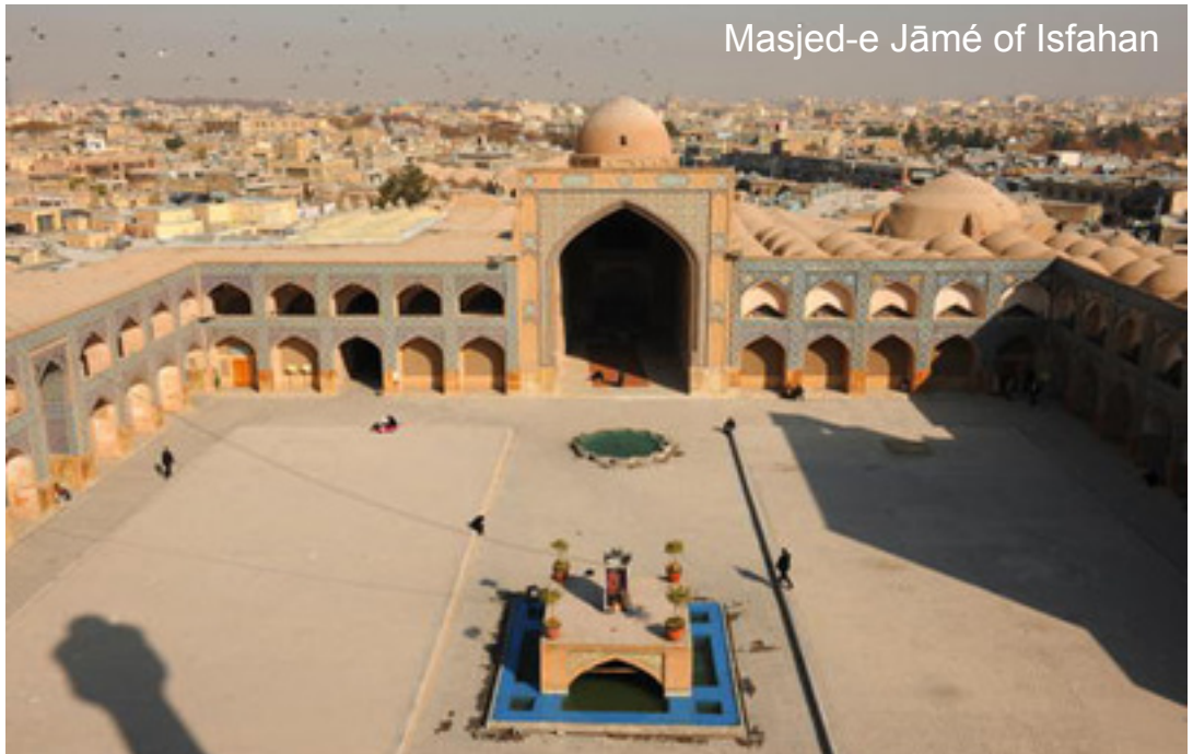
Masjed-e Jāmé of Isfahan

Il est situé à 10 km au sud de Jérusalem sur les sites que les Chrétiens reconnaissent traditionnellement, depuis le IIème siècle, comme le lieu de naissance