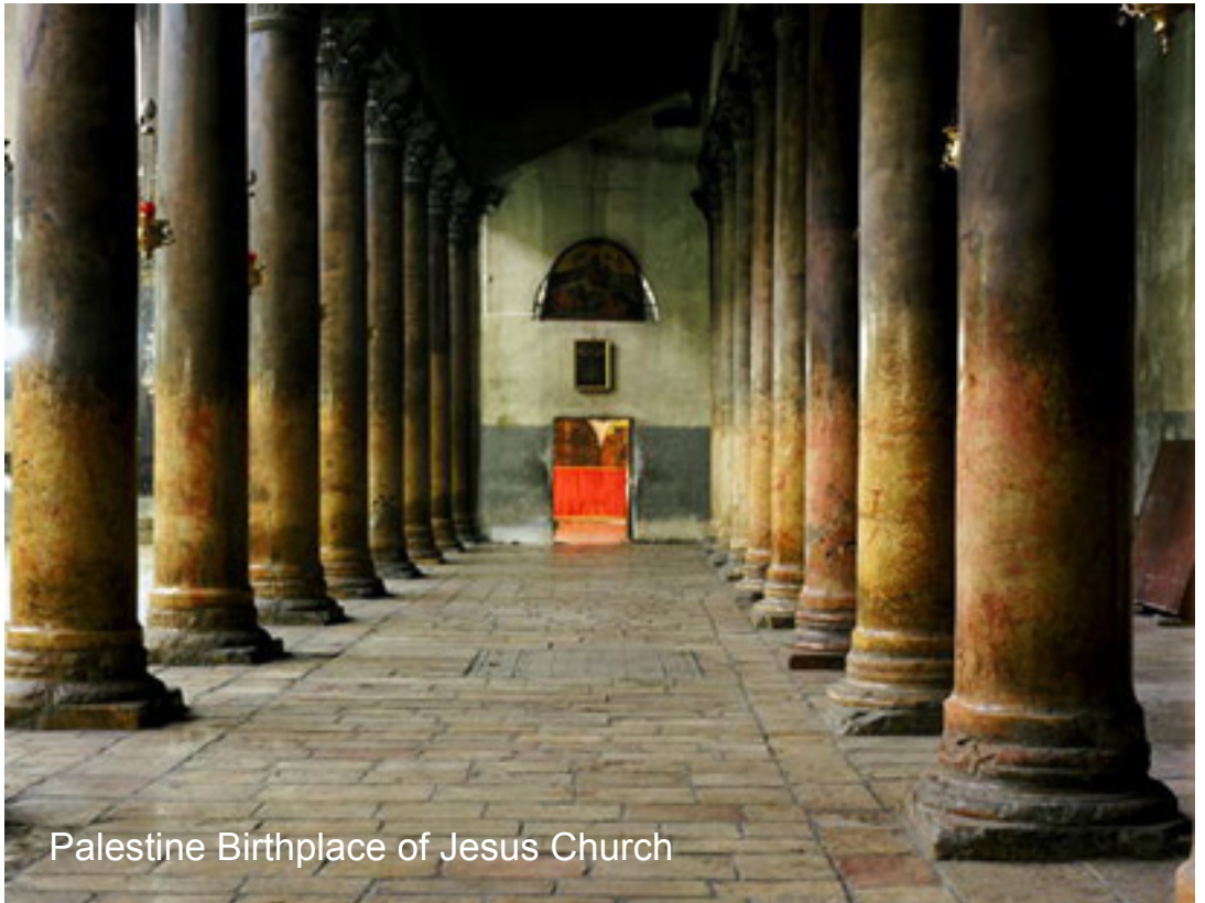
Palestine Birthplace of Jesus Church

millier d'années de l'art islamique. Ce monument illustre une succession de styles de construction architecturale et de décoration datant de différentes périodes de l'architecture islamique iranienne et couvrant 12 siècles, essentiellement les époques abbasside, bouyide, seldjoukide, ilkhanide, muzaffaride, timouride et safavide. Après son agrandissement par les Seldjoukides et l'introduction caractéristique des quatre iwans