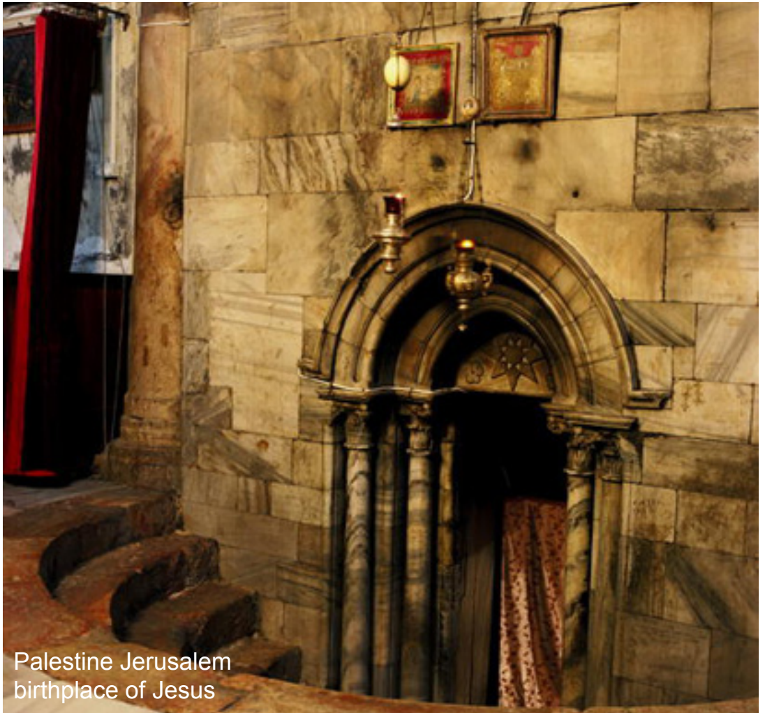
Palestine Jerusalem birthplace of Jesus

Les amateurs d'histoire, de culture et de civilisation trouveront certainement l'opportunité de visiter ces sites hautement porteurs de l'empreinte de la créativité humaine.