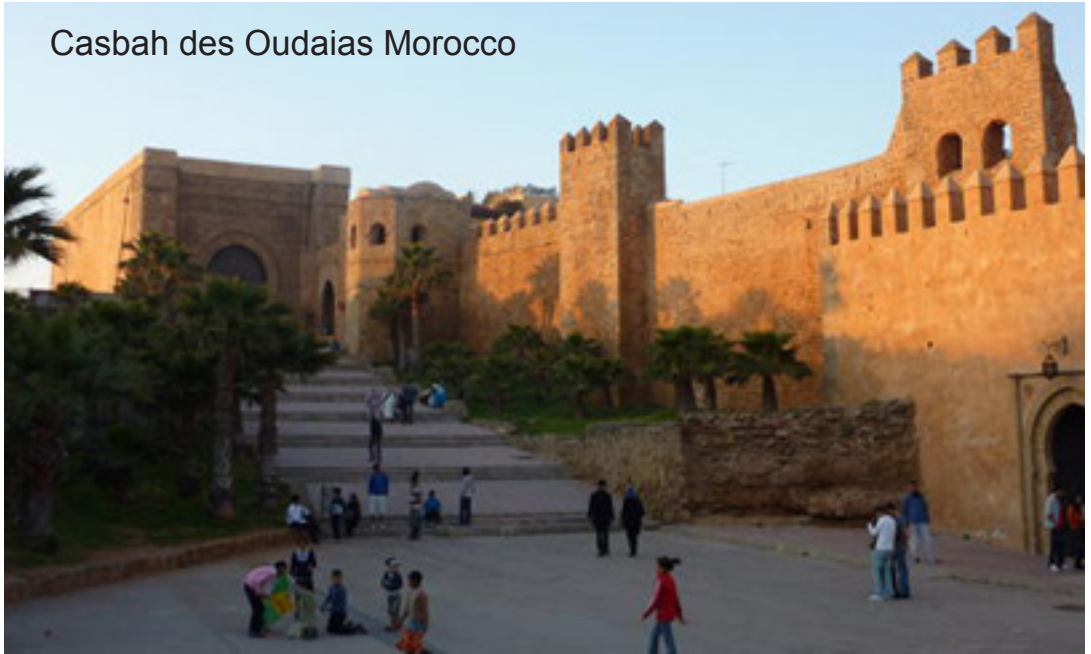
Casbah des Oudaias Morocco

Le patrimoine est l'héritage du passé dont nous profitons aujourd'hui et que nous transmettons aux générations à venir. Nos patrimoines culturel et naturel sont deux sources irremplaçables de vie et d'inspiration.