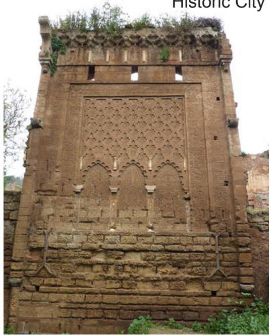
Rabat, Modern Capital and Historic City

islamique en matière de tours funéraires ; son influence se fait sentir en Iran, en Anatolie et en Asie centrale. Construit en briques cuites non vernissées, ce mausolée est conçu selon un schéma géométrique complexe pour former une tour cylindrique – de 17 mètres de diamètre à la base et 15,5 mètres sous le toit – qui s'effile vers un toit conique en briques. Il témoigne du développement des mathématiques et des sciences