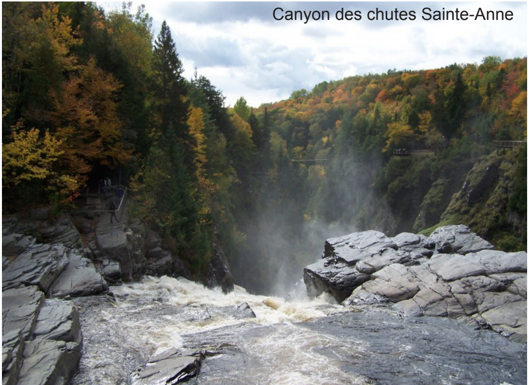
Canyon des chutes Sainte-Anne

Berceau de l'Amérique « française », le Québec est la plus grande province du Canada, et l'une des plus belles, avec des paysages naturels d'une beauté saisissante. C'est aussi une terre d'accueil.