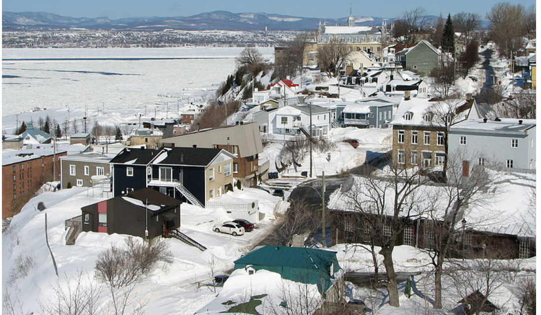
Ville de Lévis