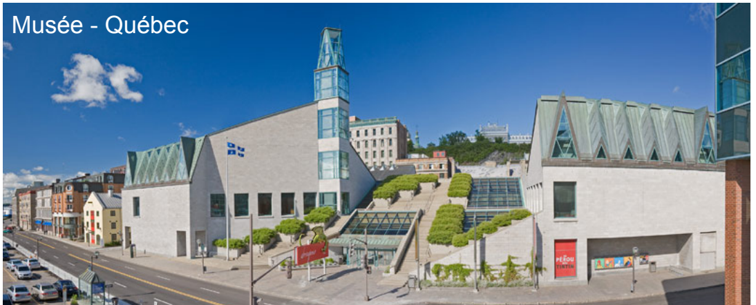
Musée - Québec

Le Parc de la Chute-Montmorency est situé à quelques minutes de la ville de Québec. Entre fleuve et falaises, c'est un des sites les plus spectaculaires de la province. L'imposante chute Montmorency (83 m) domine le paysage. On la découvre à pied, en téléphérique ou depuis le restaurant gastronomique. C'est un cadre idéal pour une promenade autant que pour une réunion d'affaires ou