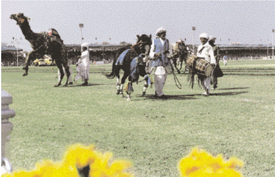
Horses and Camels Dance.

وفي وقت لاحق نعى "شهر شاه سري" همايون ابن بابور إلى بلاد فارس. وحكم الباني الباناني (الأفغاني) شهر شاه لفترة قصيرة (1530-1545). ولكنه أدخل على المنطقة إحدى أهم إنجازاتها في مجال المواصلات ألا وهو طريق شاهي (القناة الكبيرة). المعروف عادةً بطريق الجي تي. الذي يربط الشرق بالغرب عن طريق مرخبر التاريخي. الواقع في الشمال الغربي من لاهور.