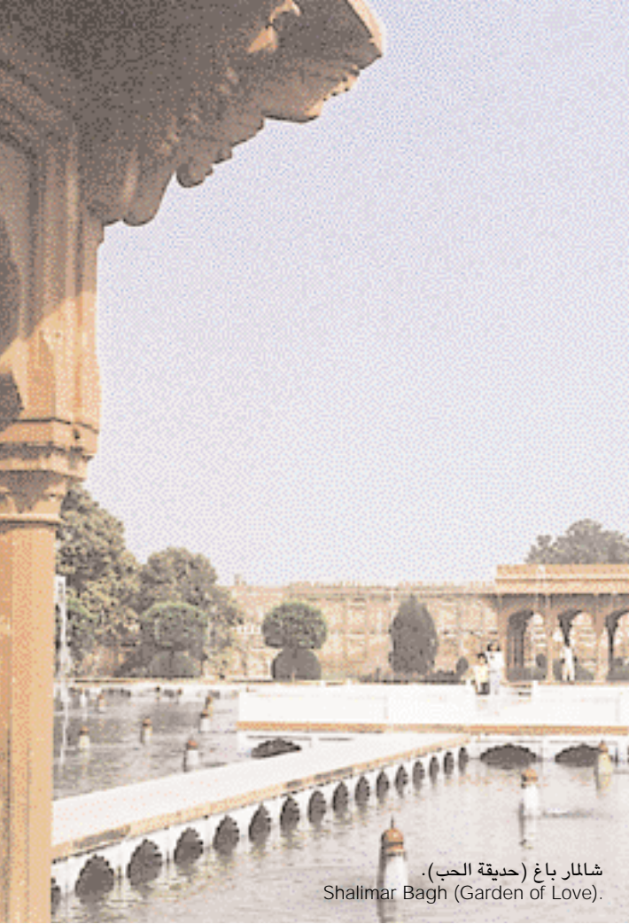
شالمار باغ (حديقة الحب). Shallmar Bagh (Garden of Love).