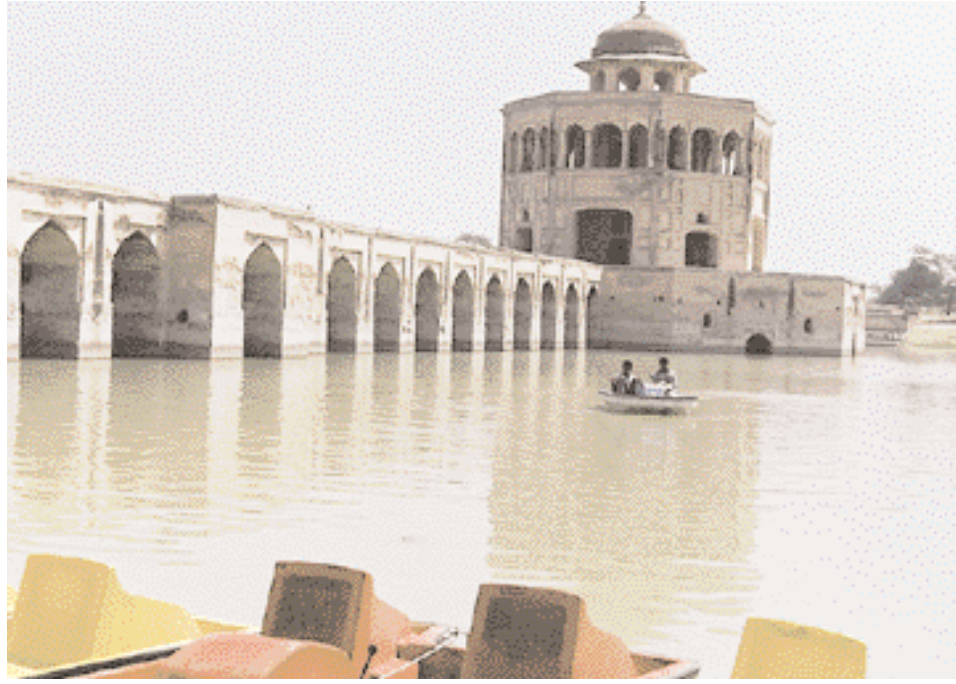
نصب الغزلان. Hiran (deer) Minar.

شاليمار باغ، أو حديقة الحب، التي فيها مئات النافورات الرشاشة التي تحتل موقعاً جميلاً في هذا المكان، وهي تعكس مدى الثراء والترف المبالغ فيه في طراز حياة المغول. وقد صمم "علي مردان خان" نظام القناة بشكل مبدع حول هذه الحدائق، التي كانت ممرات مائية مدت في خطوط مستقيمة، لإدامة السقي المنتظم والذي يؤدي بالتالي إلى تبريد كامل لمجمع الحدائق الثلاث. كما أن الأجنحة المقوّسة بشكل رائع التي تشرف على المنصة الرئيسية والمعززة بـ 150 نافورة تقوم مقام المسرح الرئيسي للفنانين الذين يتولون مهمة ترفيه العائلة المالكة.