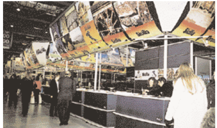
إيطاليا : واحد من أكبر الأجنحة في المعرض. Italy : One of the biggest stands in the market.

منها يبشر بالخير. وقام مثلو السياحة الإسلامية بزيارات لمعظم الأجنحة وتبادلوا المعلومات معهم. وكان الرد إيجابيا بوجه عام. السياحة الإسلامية حضرت أيضا بعض المؤتمرات الصحفية والعروض. وبضمنها مؤتمري أندونيسيا وفلسطين. أندونيسيا متحمسة لتغيير صورتها بعد تفجيرات بالي. بينما ركز الفلسطينيون على السياحة الدينية وقدموا عرضا رائعا جدا. مجهودهم يستحق التشجيع والإكبار. ونحن ندعو لهم. ولجميع المعارضين العرب والمسلمين. بالنجاح في المستقبل. ونخص بالشكر الشركة المنظمة. ريد. لتوفيرها حجرتي صلاة للمسلمين. وشكر من أعماق القلب للجناح المصري لحفاوتهم الكبيرة والإفطار الذي وفره لجميع الصائمين كل مساء. إنه مثال يجب أن يتبع.