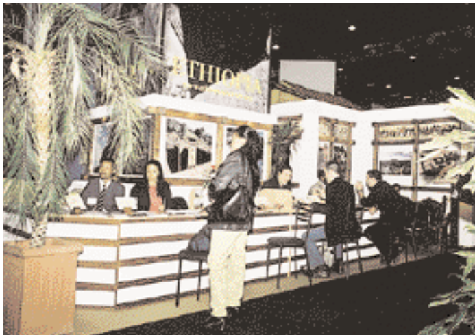
The Ethiopian stand.