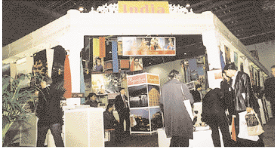
India : Magical as ever.