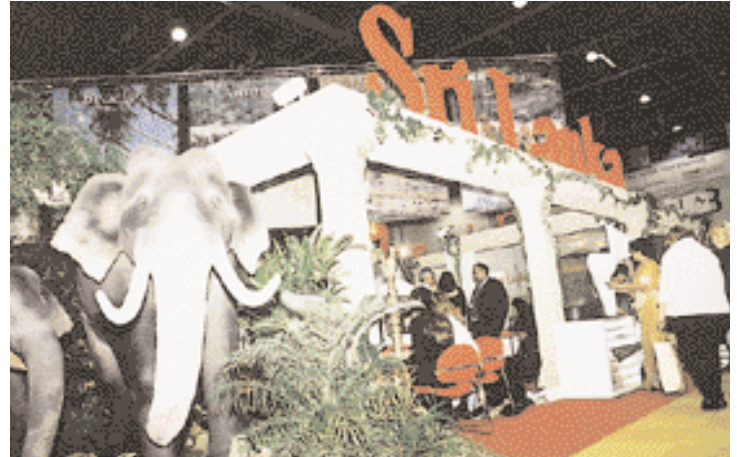
Sri Lanka : The land of elephants.