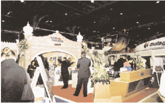
Malaysia : The old & the new.