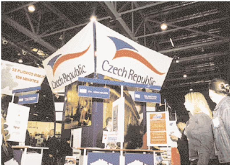
جمهورية التشيك : استعادة لجاذبيتها السياحية. Czech Republic : Regaining its tourism attraction.