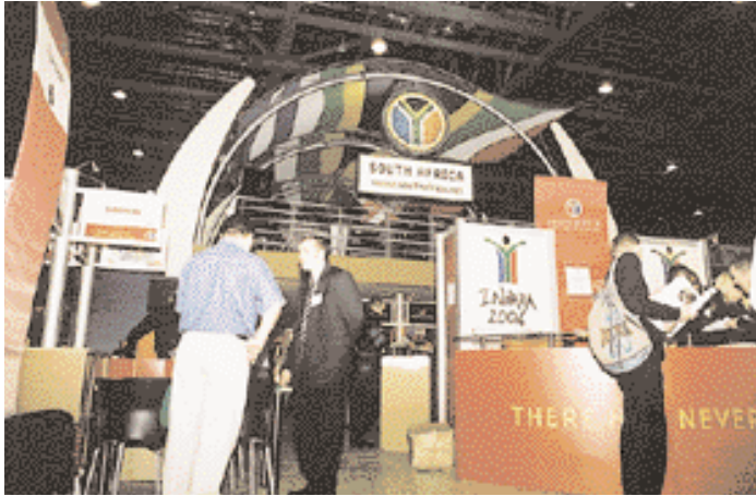
جنوب أفريقيا : أقامت أكبر حفلة توديعية.

South Africa : Made the biggest farwell party.