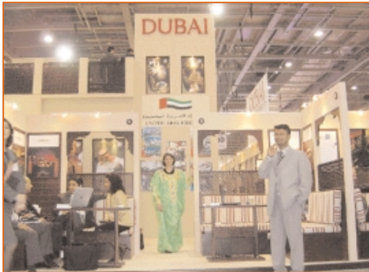
Dubai : Amazing tourism activity. دبي: نشاط سياحي مذهل.