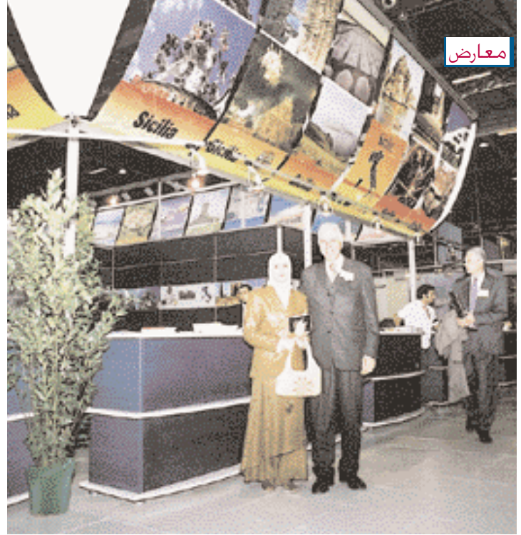
The publisher and his wife.

South Africa : Made the biggest farwell party.