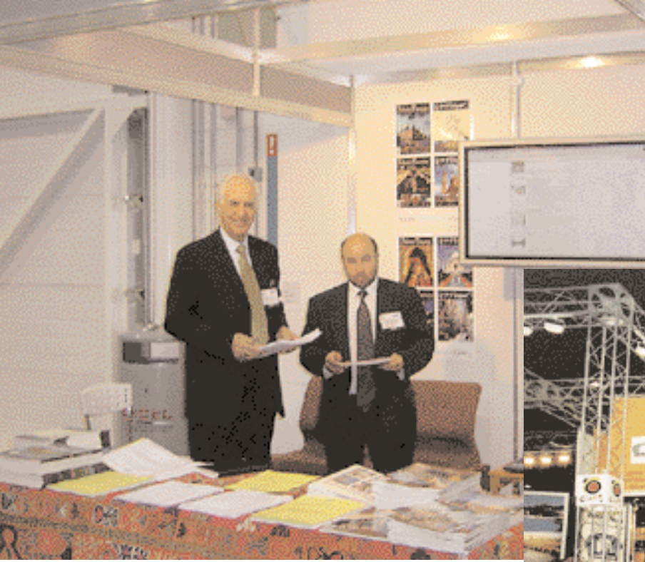
صورة تجمع السيدين الناشر ورئيس التحرير في جناح السياحة الإسلامية. The publisher and the editor-in-chief at the Islamic tourism stand.