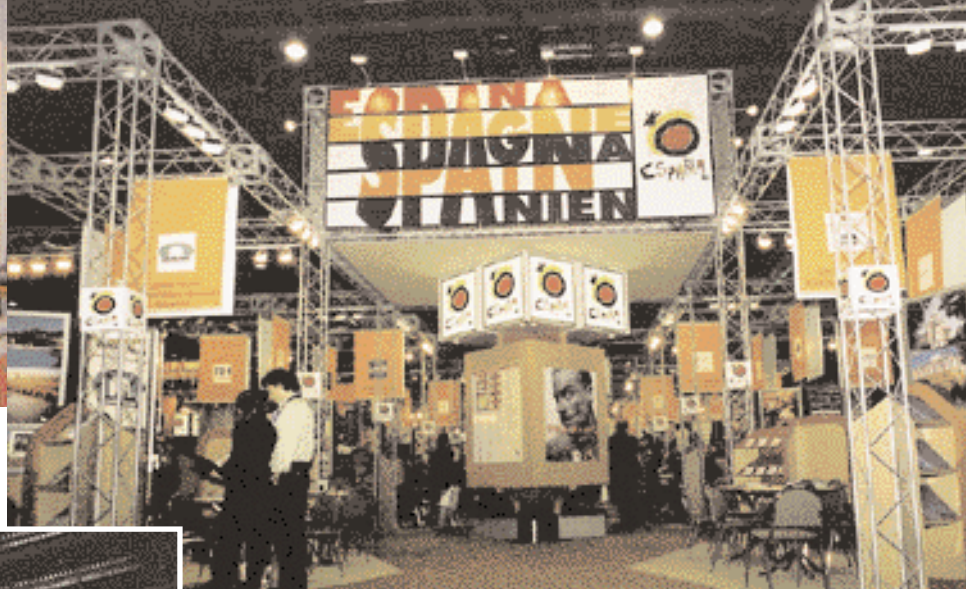
Spain : The sun and the sea.