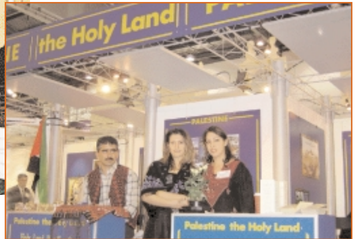
Palestine : Emphasis on identity and heritage. فلسطين: اعتزاز بالهوية والتراث.