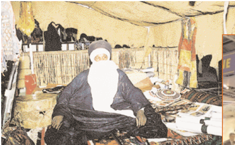
A Tuareg man in the Libyan Stand. رجل من الطوارق في الجناح الليبي.