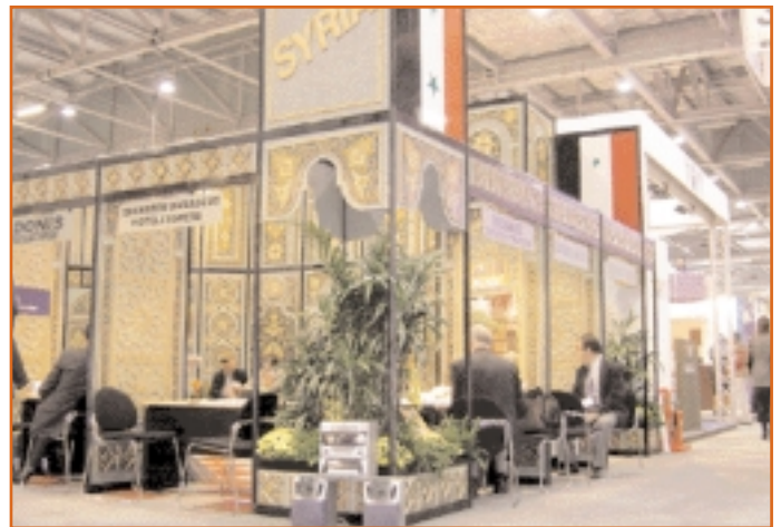
Syria : The land of civilizations. سوريا: بلد الحضارات.

الندوات المفتوحة، ورش العمل، المؤتمرات وبرنامج العروض. كلها قد جمعت خبراء صناعيين بارزين، ومدراء الإدارة العليا المحترمين، ولائحة غير مسبوقه